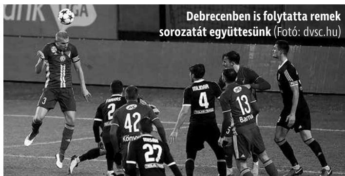
Debrecenben is folytatta remek sorozatát együttesünk