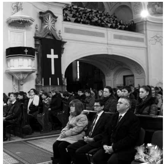
Szentmisével kezdődött a lelki nap