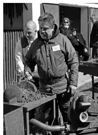
A rendezvény szerves része: a locsolkodás és a kovácstalálkozó