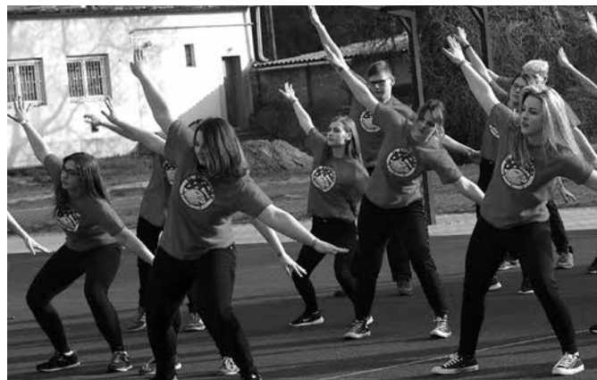
Változatos programokat kínált az idei diáknap is