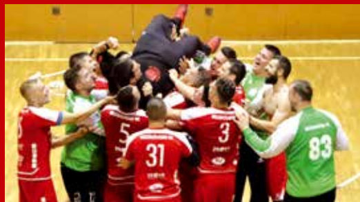
Egy év után ismét az élvonalban szerepelhet az MKC

Csapatunk a zárófordulóban a megyei rivális Ózd együttesét fogadta május 12-én. Miután az MKC legyőzte az észak-borsodiakat, megnyerte a bajnokságot. A mérkőzésről és a bajnoki ünneplésről bővebben lapunk következő számában olvashatnak. bokri