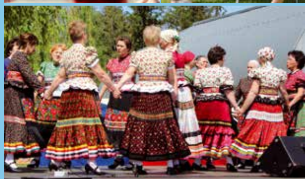
Hagyományörzés – népzene és -tánc