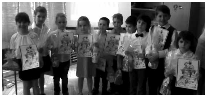
Tíz óvodás gyermek mondott verset a Szóbátorság Szavalóversenyen