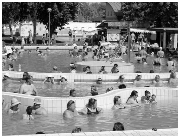
Május 1-jén hivatalosan is megkezdődött a strandszezon

Éjszakai fürdőzést júliusban és augusztusban összesen 2-3 alkalommal fognak szervezni, az egyik a strand partyhoz kapcsolódhat, abban az esetben, ha sikerül a rendezvény szervezőivel megállapodni.