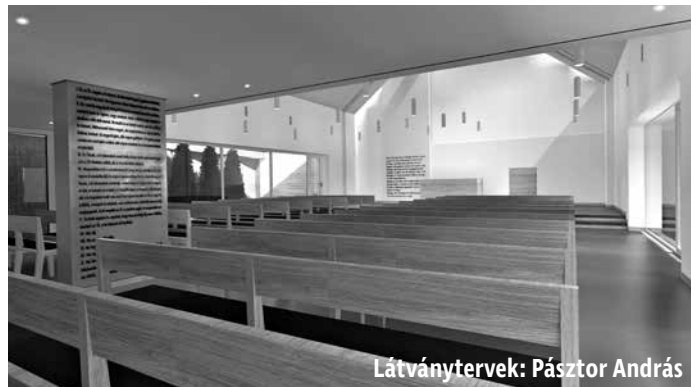
Látványtervek: Pásztor András

A tervek szerint idén megkezdődhetnek a munkálatok és fel is épülhet az új református templom városunkban. A Mezőkövesdi Református Egyházközség 200 millió Ft-os támogatást kapott az Emberi Erőforrások Minisztériumától (EMMI) emellett a mezőkövesdi önkormányzattól ingyenesen kapta meg a Gaál István úti telket.