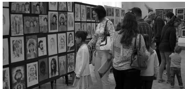
Tárlat a művészeti diákok munkáiból

Több mint 500 alkotást lehet megtekinteni az Alapfokú Művészeti Iskola képző- és iparművészeti tagozatának év végi vizsgakiállításán. A nyitó ünnepséget május 25-én rendezték meg a Közösségi Házban.