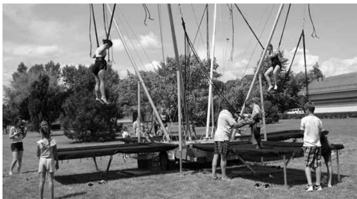
Nagy sikert aratott az eurobungee

Színes programokkal és ismert fellépőkkel várták a családokat május 26-án, a Városi Gyermekeknapon.