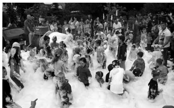
A tombolasorsolás utáni habparti aratta a legnagyobb sikert a kicsik körében, akik el sem akartak mozdulni a habfújó gép előtt