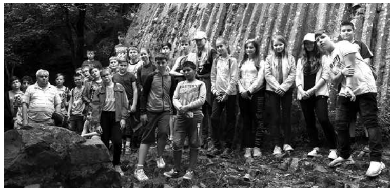
Túrázás, játékok, tanulás – egy hét az erdei iskolában

A 6.a és 6.b osztály tanulói és osztályfőnökei