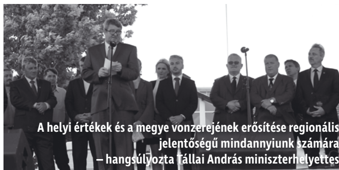
A helyi értékek és a megye vonzerejének erősítése regionális jelentőségű mindannyiunk számára – hangsúlyozta Tállai András miniszterhelyettes

ÉRTÉKDÍJ Ezt követően bemutatkozott a Kassa megyei önkormányzat, a Sziléziai-vajdaság, a kárpátaljai regionális parlament és a kárpátaljai megyei tanács delegációja is. Az ünnepség részeként összesen 8 szakterületen adtak át Borsod-Abaúj-Zemplén Megyei Értékdíjat, illetve különdíjat. A megyenap keretében két testvértelepülési megállapo-