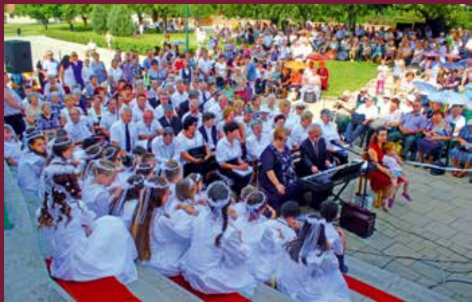
Több százan látogattak ki idén is az áhítatra