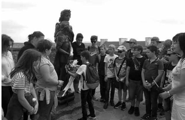
Hasznos és érdekes volt a tanulmányi kirándulás

Első nap Ungváron, a skanzen épületeit nézhettük meg. Majd a munkácsi várban kuruc dalokat énekelve megkoszorúztuk Zrínyi Ilona és II. Rákóczi Ferenc szobrát. A városban 2 görögkatolikus templomot csodálhattunk meg. Sztálin áldozatainak emléktáblája mellett elhaladva Munkácsi Mihály szobránál érdekes történeteket hallgattunk a festőről. A háttérben a Rákóczi-család nyári rezidenciája volt. A főtéren csoportos feladatokat oldottunk meg, szobrokat kerestünk és fényképeket készítettünk.