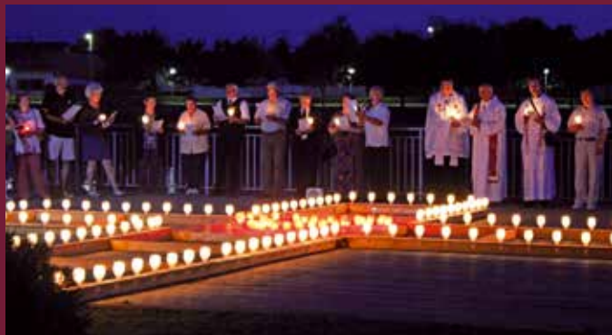
Hívek a búcsú nagy kereszt körül