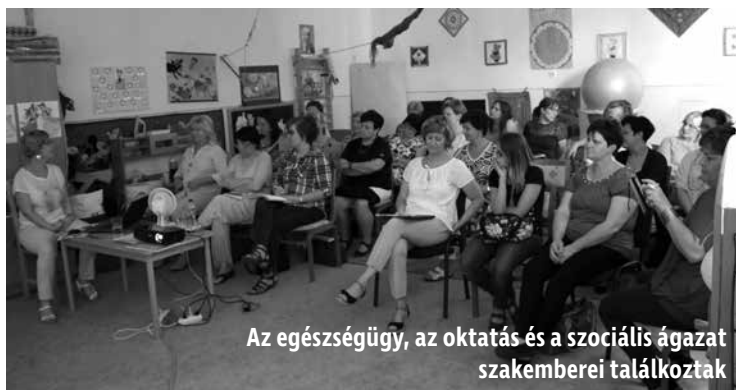
Az egészségügy, az oktatás és a szociális ágazat szakemberei találkoztak

A Borsod-Abaúj-Zemplén Megyei Pedagógiai Szakszolgálat Mezőkövesdi Tagintézményében került megrendezésre 2018. május 28-án a pályázat keretében megvalósuló „Járási Kapocs – Ágazatközi együttműködést segítő programsorozat”.