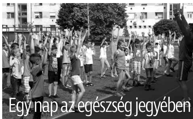
Egy nap az egészség jegyében

Égésznapot tartottak a Mező Ferenc Tagiskolában és a Szent Imre Tagiskolában június 12-én, illetve 13-án.