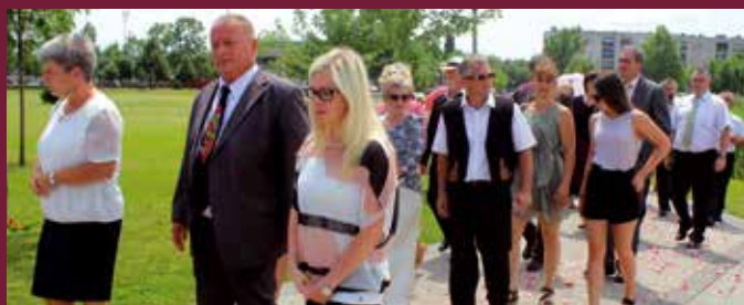
A város és az egyház képviselői, családok, hívek csoportjai kísérték az Oltáriszentséget