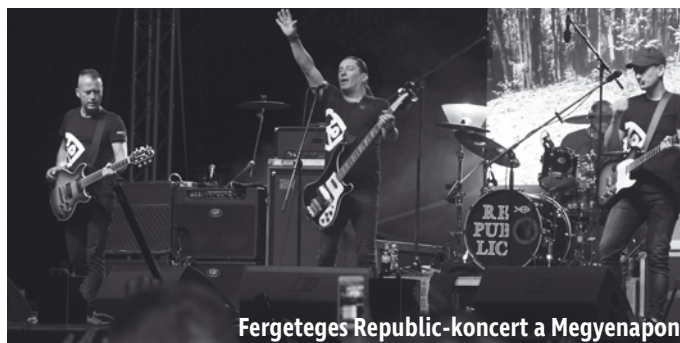
Fereteges Republic-koncert a Megyenapon

dás is született két-két borsodi és kárpátaljai település között: Bükkábrány Iloncával, míg Sajóabony Kincseshomokkal kötött megállapodást.