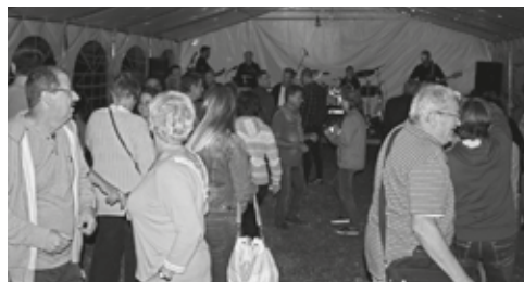
Már hagyomány a Cuharé, mely egyre népszerűbb része a rendezvénynek