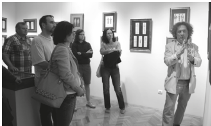
Laczkó-Pető Mihály egyedi tárlatvezetése: érdekességek a Takács Istvánról és alkotásairól