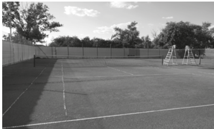
Új automata öntözőrendszer, valamint háttér- és pályaelválasztó háló a Hadnagy úti Sportcentrumban

DÖNTÉSEK A Borsod-Abaúj-Zemplén Megyei térséget érintő, a hulladékgazdálkodási integráció okán bekövetkező változások, valamint a KEHOP projektek maradéktalan megvalósítása érdekében a Mezőkövesdi Hulladékgazdálkodási Önkormányzati Társulás megszüntetésére, valamint az önkormányzatnak a Miskolci Regionális Hulladékgazdálkodási Önkormányzati Társuláshoz történő csatlakozására van szükség. A városatyák egyhangúlag döntöttek arról, hogy a jelenlegi Társulást 2018. december 31-vel megszüntetik, 2019. január 1-jével pedig az önkormányzat csatlakozik az új Társuláshoz. A következő napirendi pontban a VG Nonprofit Zrt. új, átdolgozott 2018. évi üzleti tervét tárgyalták, amelyek elkészítésére a múlt havi testületi ülésen kérték fel a Zrt.-t. Az új terv már sokkal pozitívabb, a képviselők a társaság 2018. évi üzleti tervét 494.000 forint adózás előtti eredmény szerinti összegben elfogadták. Szintén a múlt havi ülésen kérték fel a Mezőkövesdi Média Nonprofit Kft.-t a 2018-as évre vonatkozó intézkedési terv készítésére a Kft. további