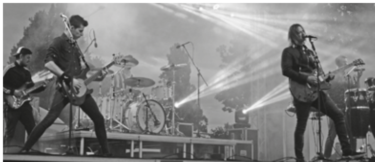
Alternatív rock az Intim Torna Illegáltól