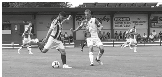
Egy győzelem, egy vereség a Slavia Praha ellen