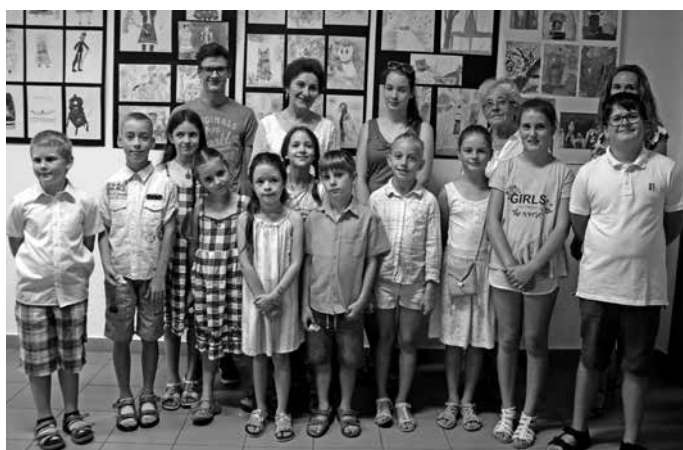
A gyerekek munkáiból nyílt tárlat október 5-ig látható a Közösségi Ház aulájában

– A gyerekekkel voltunk a Matyó Múzeumban, ahol megfigyelték a babakiállítást és filmet is néztünk, jártunk a Városi Galériában, a tájházakban, minden helyszínen rajzoltak, festettek, a környezetet és az adott témát véve alapul. Mezőkövesd gazdag néphagyománnyal rendelkezik, fontos, hogy ezeket megismerjék. Idén egy hosszabb kirándulás volt, leszálltunk a Hórvölgye bejáratánál, aztán elmentünk a Suba-lyukhoz is, a gyerekek gyűjtögettek az úton, bogarakat, pillangókat és a végső cél a cserépfalui Oszlai tájház volt,