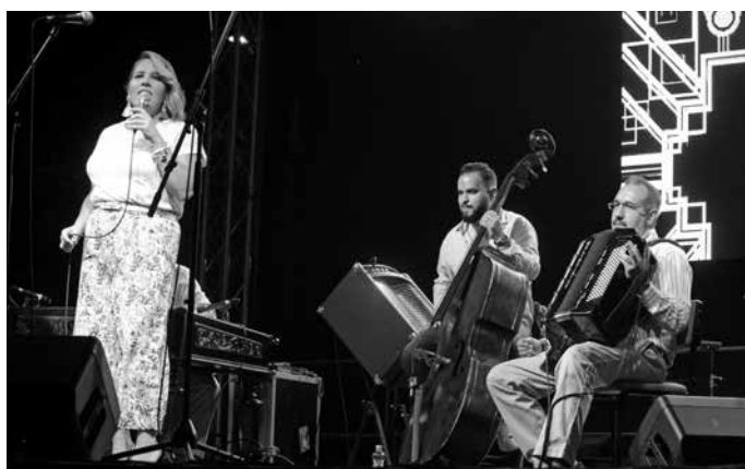
Tóth Vera is fellépett a Folklorfesztivál keretében

KONCERT Mezőkövesdre Tóth Verával, Mező Misivel, Keleti Andrással és Kollár-Klemencz Lászlóval érkezett a zenekar, az énekesek felpörgették a kövesdieket, a színpad előtt többen táncrea is perdültek. – Játszottunk dalokat az új, Budapest című albumról is, ami merőben szembemegy az előzőekkel, hisz többnyire az énekesek írták a dalokat és a zenekar hangszerelte. Ez is fontos volt