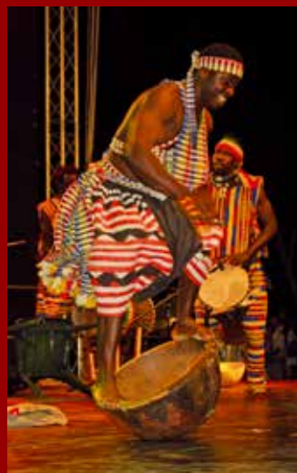
A szenegáli Camara együttes előadása