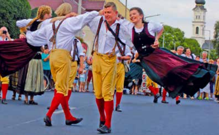
Testvérvárosunkból, Bad-Salzungenből érkezett a Werrataller táncsoport