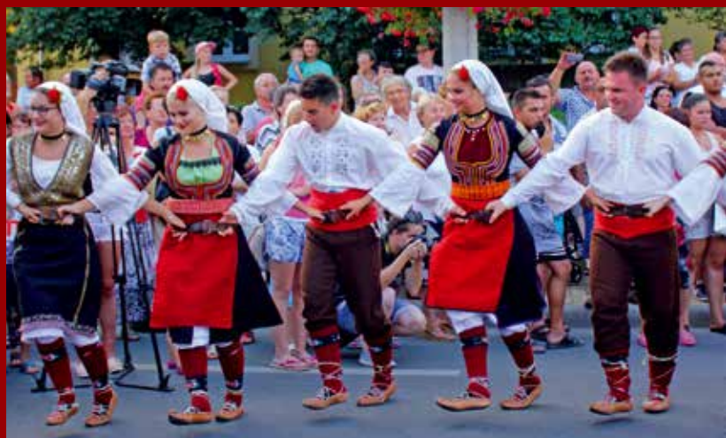
A Tököli Délszláv Nemzetiségi Együttes