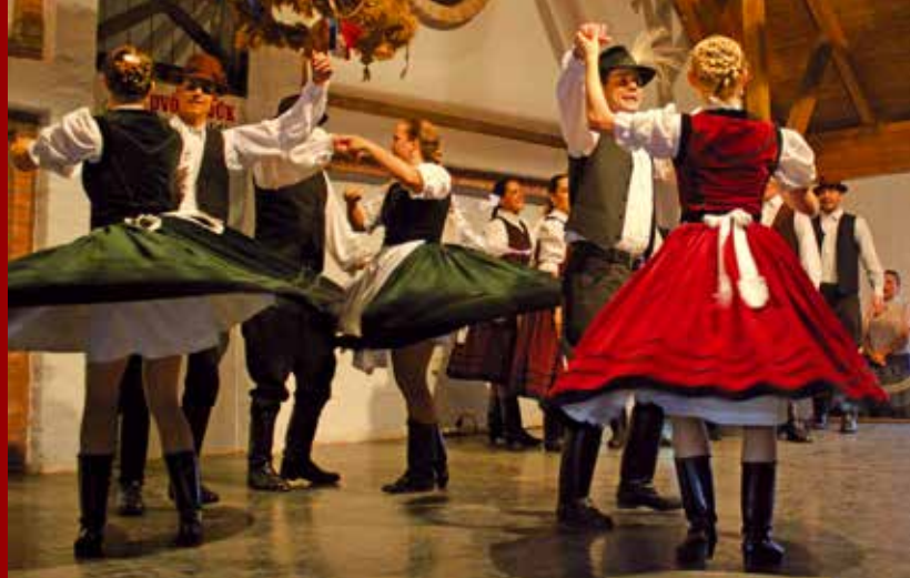
Két ősbemutatót is láthattunk: a Matyó Néptáncgyűttes Summás voltam a határon és a Matyó Népi Együttes Multság matyó módra című összeállítását