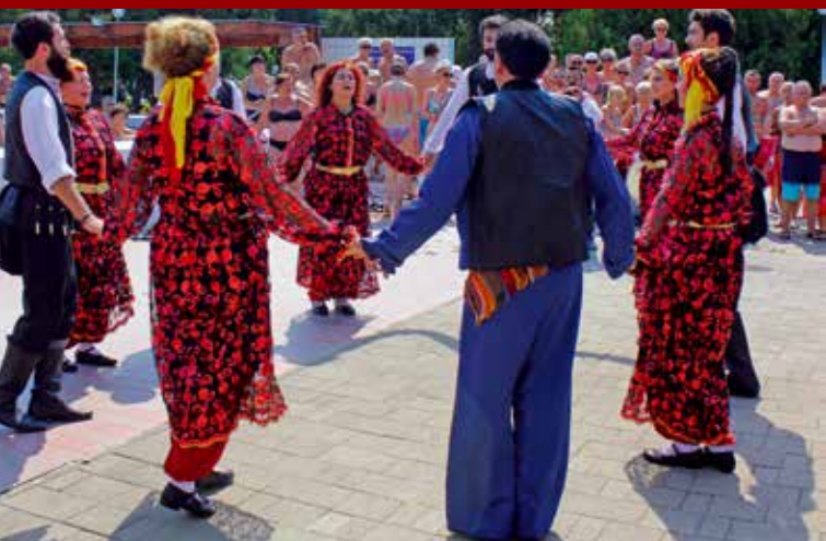
A Besik táncsoport négy különböző koreográfiát mutatott be