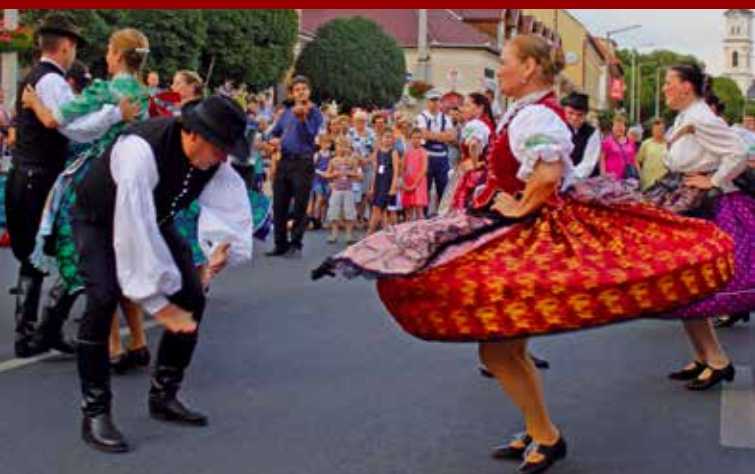
A Budapesti Vadrózsák Táncgyűttes tagjai