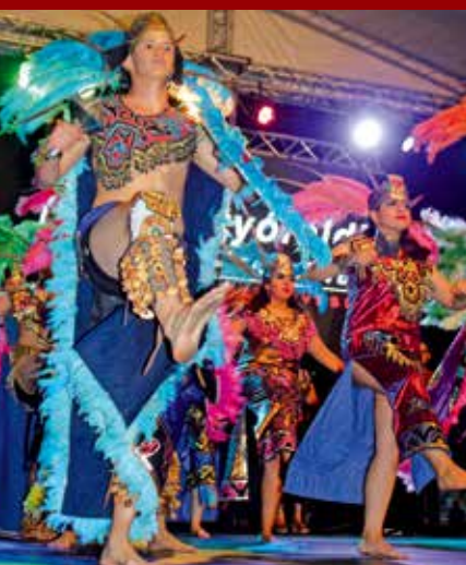
Lendületes produkcióval rukkolt elő a mexikói táncsoport