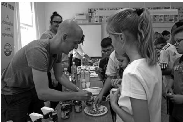
A Szent Imrében az első napon Menő menza programon vehettek részt a diákok