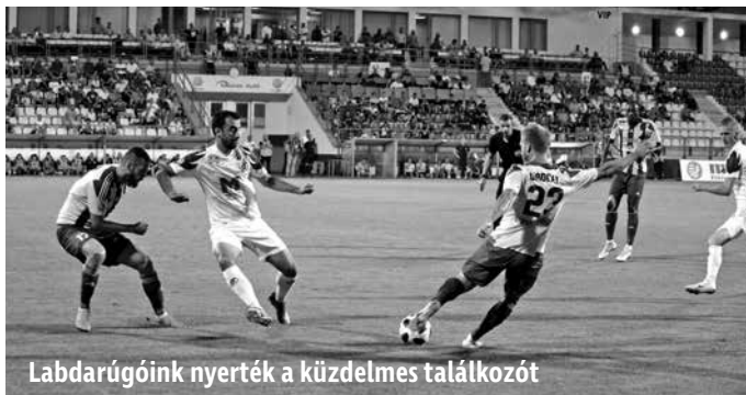
Labdarúgóink nyerték a küzdelmes találkozót

Együttesünk 8 ponttal a 6. helyen áll a tabellán. A Mezőkövesd Zsóry legközelebb a DVTK-t fogadja szeptember 15-én a Városi Stadionban.