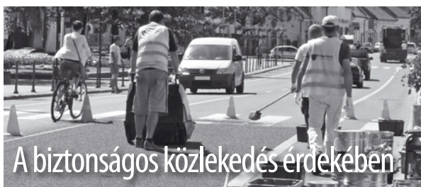
A biztonságos közlekedés érdekében

Living Road csúszásgátló útburkolati rendszert alakítottak ki városunk főutcáján az önkormányzat finanszírozásában. Augusztus utolsó előtti hetében kezdődtek meg a munkálatok és a hónap utolsó napjaiban el is készült a burkolat. A Szent István Katolikus Általános Iskolánál, a Miskolci Szakképzési Centrum Mezőkövesdi Szent László Gimnáziuma, Közgazdasági Szakgimnáziuma és Kollégiuma, valamint a Matyó Áruház előtt telepítették a rendszert a zebbrák előtt a Hungarian Road Kft. szakemberei. D. A.