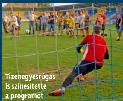
Tizenegyesrúgás is színesítette a programot

Magabiztos, 3-0-ás győzelmet aratott a Mezőkövesd Zsóry II a Gesztely ellen lejátszott megyei I. osztályú bajnoki mérkőzésen, amit a „A Futball Éjszakája” keretében, szeptember 7-én játszottak le.