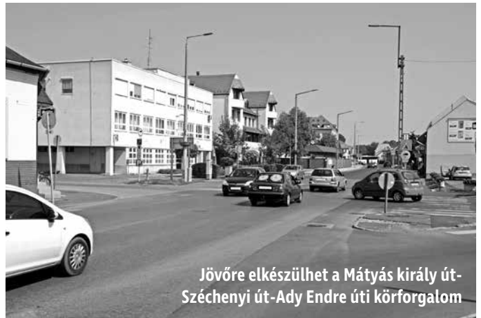
Jövőre elkészülhet a Mátyás király út-Széchenyi út-Ady Endre úti körforgalom

DÖNTÉSEK Az első pontban a Bursa Hungarica Felsőoktatási Önkormányzati Ösztöndíjpályázat 2019. évi fordulójához való csatlakozásról szavaztak a városatyák, egyhangú döntés született arról, hogy jövőre is támogatja az önkormányzat a hátrányos szociális helyzetű felsőoktatásban résztvevő hallgatókat, illetve felsőoktatási tanulmányokat kezdő fiatalokat. A képviselők egyhangúlag elfogadták, hogy a közmeghallgatás megtartására idén november 15-én 17 órakor kerüljön sor a Községi Házban, melynek napirendje az ön-