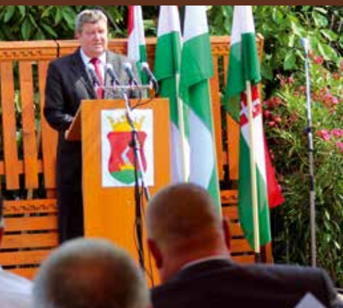
Immár 20. alkalommal rendezték meg a nagyszabású eseményt, melynek fővédnöke Tállai András

A szeptember 1-jén rendezett eseményen a hagyományokhoz híven veterán gépcsoadók vonultak fel városunk főutcáján. Több ezren nézték meg a személy- és teherautókat, köztük a matyó mintákkal díszített Trabantot, valamint a traktorokat, motorokat, buszt és tűzoltóautót. A több mint száz gépcsoad között egy különleges BTR-80-as típusú harci csapatszállítót is láthattunk végiggurulni a Mátyás király út – Kavicsos-tó – József Attila és Eötvös József utca útvonalon.