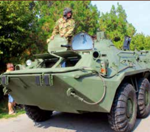
A BTR-80-as típusú nyolckerekes páncélozott csapatszállító az 5. Bocskai István lövészdandár tagjaival

Veterán járművek, gépbemutatók és szakmai előadások a XX. Országos Mezőgazdasági Gépésztalálkozón.