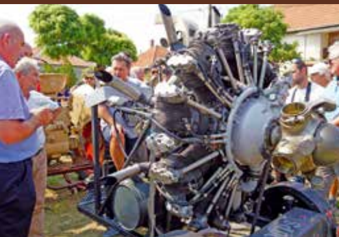
A 9 hengeres, 1000 lóerős, 30 ezer köbcentiméteres AN-2-es repülőgépmotort többször is beindították