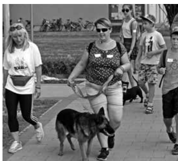
Kutyák és gazdik közösen sétáltak