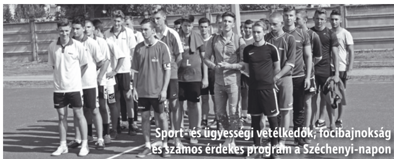
Sport- és ügyességi vetélkedők, focibajnokság és számos érdekes program a Széchenyi-napon