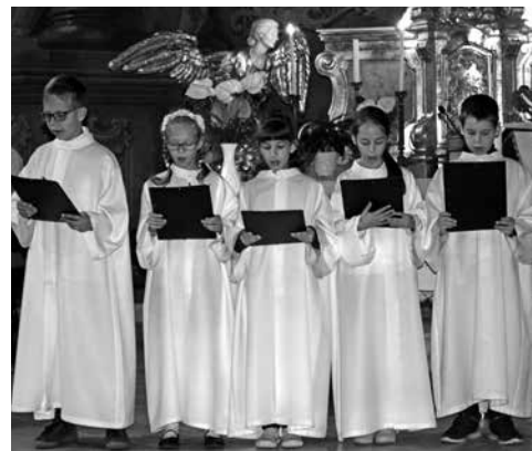
A Szent László Gyermekkórus is fellépett

„Lenn a Földön, fenn az égben” címmel zenés irodalmi műsort láthattak az érdeklődők szeptember 23-án a Szent László templomban.