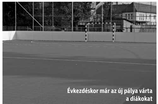
Évkezdéskor már az új pálya várta a diákokat

Nyáron a Bárdos Lajos Tagiskola udvarán rekortán kézilabdapálya épült az önkormányzat sikeres pályázatának köszönhetően, a Magyar Kézilabda Szövetség és a Magyar Kormány támogatásával. A 22 m x 42 m-es pályát, melyen két szabvány méretű, rögzített kézilabdakapu található, labdafogó hálóval és palánkkal vették körül. A Mező Ferenc Tagiskola főépületének pedig a tetőhéjazata újult meg a Tankerületi Központ és az önkormányzat közös projektének köszönhetően. A felújítás keretében a tető régi bitumenes hullámlemezait új, felületkezelt acél trapézlemezre cserélték, továbbá új ereszt alakítottak ki. A munkálatok idén tavasszal kezdődtek, a kivitelezés az időjárási és a tanítási körülményekhez igazodva folyamatosan zajlott, amely eredményeképpen a műszaki átadás-átvétel április 27-én megtörtént.