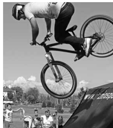
Látványos extrém bringás bemutató