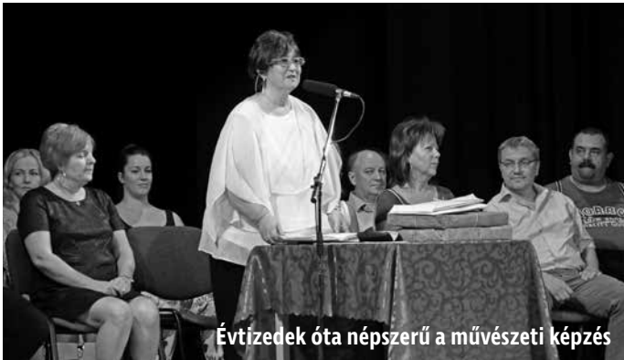
Évtizedek óta népszerű a művészeti képzés

A zeneiskolában immár az 55. tanévet kezdték meg, míg a táncoktatás 19, a képző- és iparművészeti képzés 18 éve indult el.