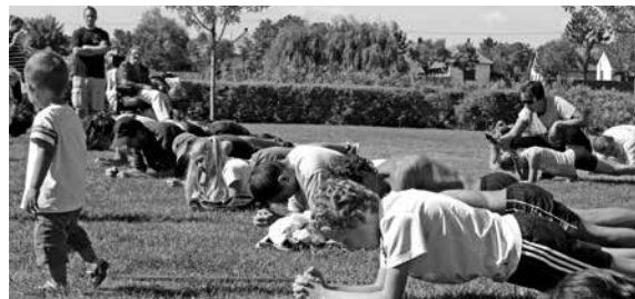
A könnyűnek tűnő plankolás valójában embert próbáló feladat