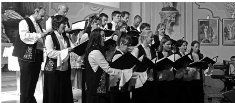
A Szent László Kórus tagjai öt dallal készültek