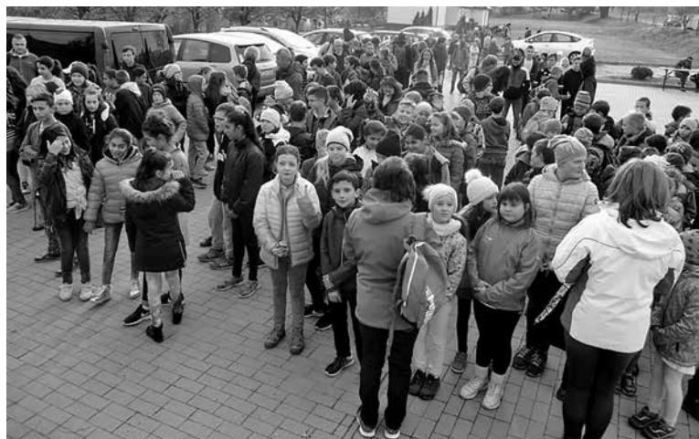
A gyerekek kedvence idén is a bükkzsérci kirándulás volt