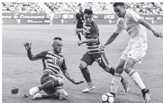
Egy góllal kapott ki csapatunk a Fraditól