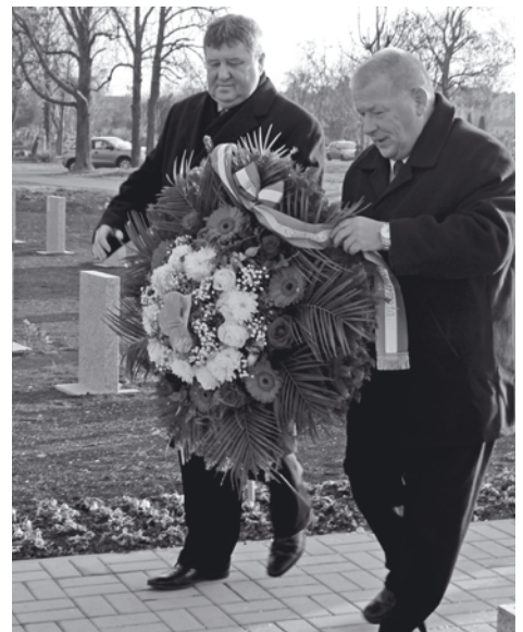
A hősök előtti tisztelgés jegyében helyezették el a koszorút