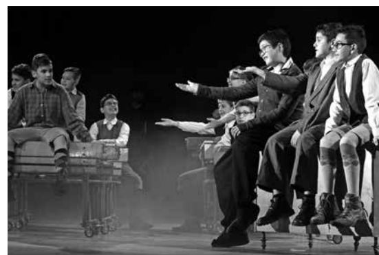
Az amatőr színtársulat tagjai nagy sikerrel mutatták be a népszerű musicalt

A Légy jó mindhalálíg című musicalt mutatta be a Mezőcsáti Színtársulat és a Debreceni Független Színház. A darab végén a közönség vastapssal hálálta meg az előadást.