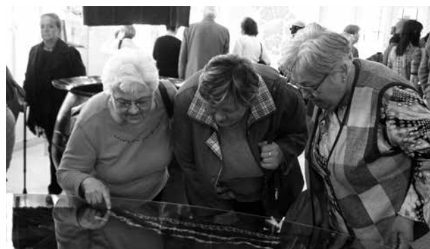
A kiállításon a textilstílus eljárási múltját fedezhetjük fel