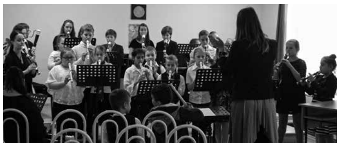
Kamaraműsor a baráti találkozóon

Első alkalommal rendezték meg a Baráti Furulyás Találkozót a mezőkövesdi Alapfokú Művészeti Iskolában.