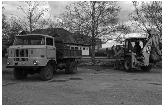
A Zsóry liget pályázat keretében út-, parkoló- és közműépítési munkák zajlanak