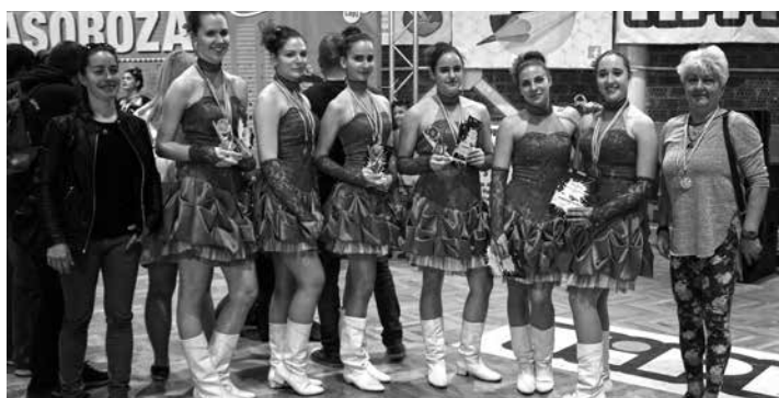
A mezőkövesdi mazsorett hat aranyérmel tértek haza