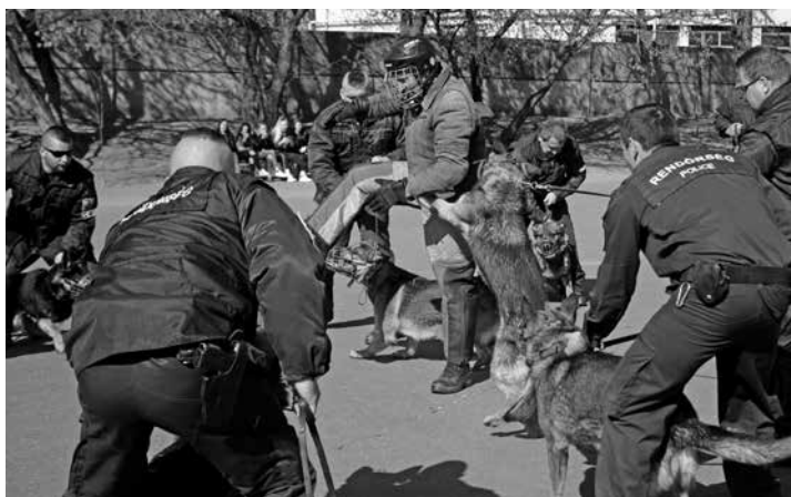
Több mint húsz kutyásrendőr vett részt a képzésen