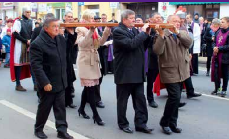
Hagyományosan az egyház, az önkormányzat, intézmények, valamint civil szervezetek képviselői vitték a feszületet a stációk között