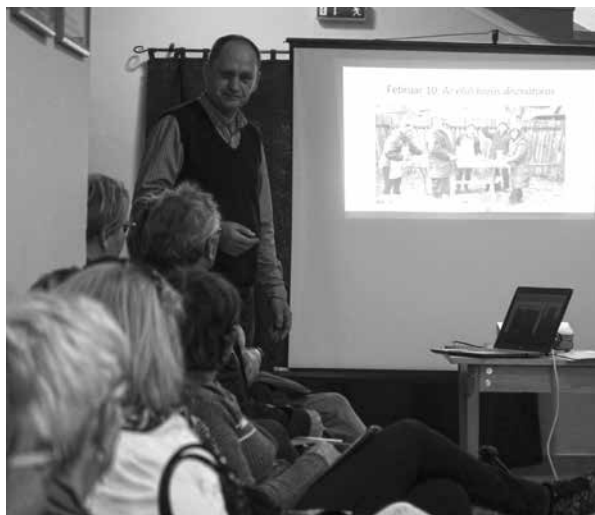
Az egyesület tagjai aktív tevékenységet folytattak 2018-ban is