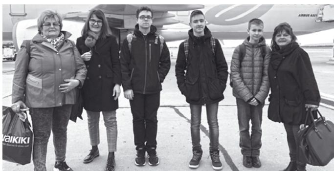
A bulgáriai projektalálkozón részt vevő magyar csoport

Sliven (Bulgária) 2019. február 23. – március 2.