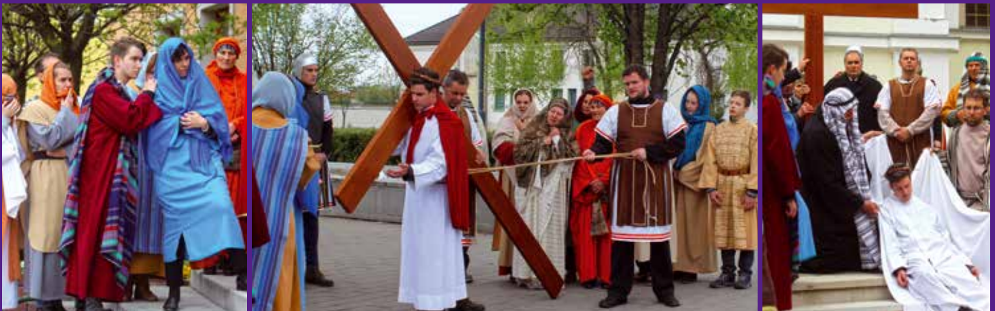
A szereplők korbács ruhában elevenítették fel Jézus keresztútjának egyes állomásait, a halálra ítéletétől a sírba tételéig