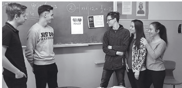
A gimnáziumban jelentős szerepet kap a tudatos pénzgazdálkodásra nevelés