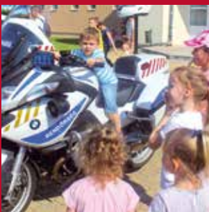
Ifjú „motoros rendőr”