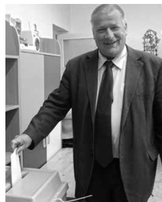
Részvételben és a Fidesz-KDNP-re leadott szavazatokban is az országos átlag fölött teljesített Mezőkövesd

– Szeretnék köszönetet mondani a 7. számú választókerület lakóinak az európai parlamenti választáson való részvételükért, valamint a Fidesz-KDNP nagy arányú támogatásáért. Választókerületünk 54 településének 76%-a az országos átlag fölött támogatta a Fidesz-KDNP-t, sőt, 46 település, azaz 85% átlépte az 50%-os támogatási küszöböt. Ezek a számok önmagukért beszélnek. Büszke vagyok rá, hogy Dél-Borsod és a Bükkalja lakói magukénak érezték az európai parlamenti választás ügyét, fontosnak tartották, hogy véleményt mondjanak egy jelentős kérdésben, mely hosszú távon meghatározhatja hazánk és kultúránk jövőjét – emelte ki Tállai András országgyűlési képviselő a voksolás kapcsán.