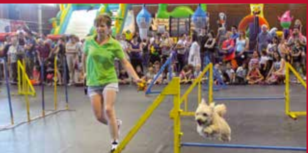
A gyerekek öröme: kutyabemutató