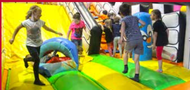
Különböző nehézségű ugrálóvárak, csúszdákkal és izgalmas akadályokkal