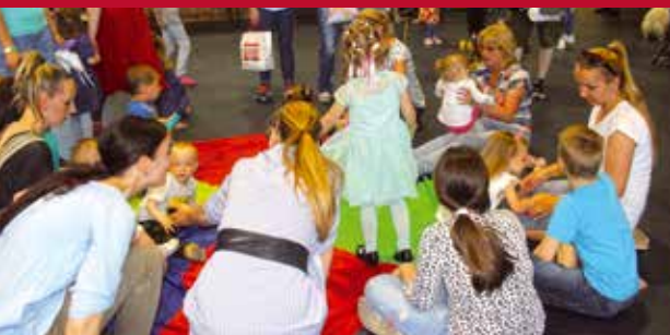
Mazsola Muzsika: játékos zenei fejlesztés