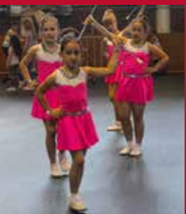
Kövesdi mazsorettek bemutatója