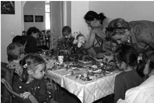
Hasznos és érdekes programokkal várták mindenkit a múzeumban