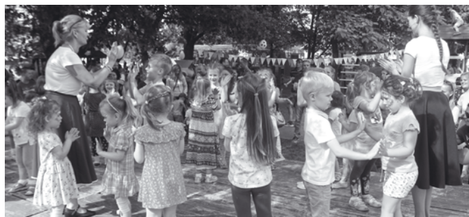
Szülők és gyermekek egyaránt jól érezték magukat az ovis programon

Ezen felül például Disney-figurákkal való fényképezkedés, kézműves foglalkozások, arcfestés, csillámtetoválás, lufihajtogatás, célba dobás és horgászat is szerepelt a programban. B. Krisztián