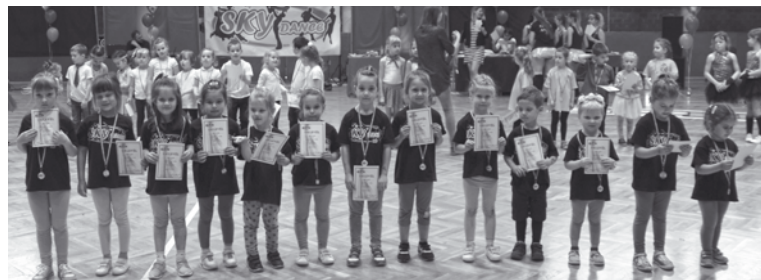
A legkisebbek is aranyérmesek lettek

4 egyesület fiatal táncosai mutathatták be az év során elsajátított tudásukat a Városi Sportcsarnokban a június elsejei megméretésen. A helyi formációk mellett az Egerből, Szikszóról, Miskolcra, Tiszaújvárosból, Noszvajról, Bükkábrányból és Hevesről érkezett csoportok 23 kategóriában versengtek egymással a SkyDance SE által szervezett gálán. Az indulók teljesítményét háromtagú zsűri értékelt. A kövesdi táncosok sikeresen szerepeltek, a Manócskák mirror, a No Name Team junior kisművészi C, a Sky Angels junior kisművészi A, a Fehér Tigrisek children nagyművészi D, a Funny Girls serdülő nagyművészi C, a Fanatik pedig felnőtt kisművészi B kategóriában szerezte meg az első helyet. D. A.