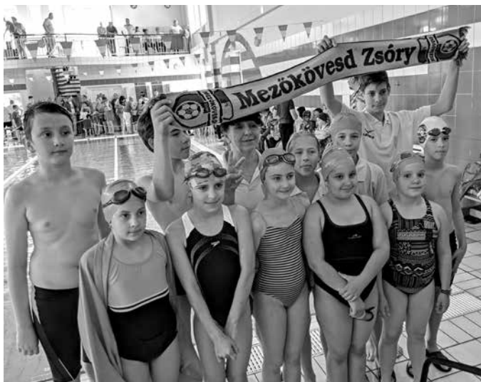
Sikeres szereplés Vásárosnaményban