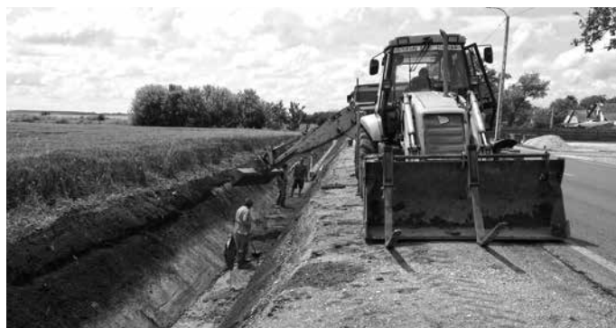
A Zsóry liget projekt keretében az Ostoros-patakba vezető, út menti árok burkolása folyik, illetve a parkoló és az azt kiszolgáló út építése is elindult