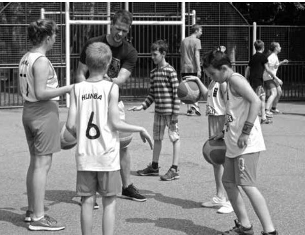
A kosárlabda is népszerű volt a diákok körében

Kilenc településről mintegy 500-600 gyermek látogatott el a június 7-én tartott Sportágválasztó programra.