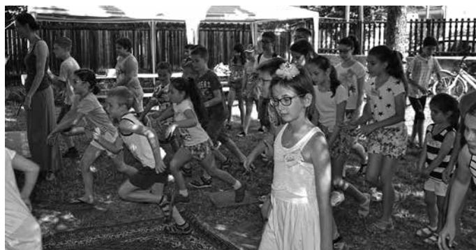
Táborozó gyerekek

A tábor napirendjéről: a reggelek közös tornával indultak, amit idén az ötödikes lányok tartottak. Reggeli után a felnőtt segítők Gordos Attila lelkész vezetésével napindító áhítatra gyűltek a templomba, majd a gyerekek vidám, Istent dicsőítő ének-tanulása jött Éva néniel, és a bibliai történetek játékos feldolgozása Attila bácsi szórakoztató, mai interpretációjában. Ezt követően a gyermekek korcsoportok szerint a pedagógus csoportvezetőkkel dolgozták fel a tábor idei tematikáját adó, érzékszervekhez kapcsolódó feladatokat játékos, interaktív formában. (Pl. A hit az,