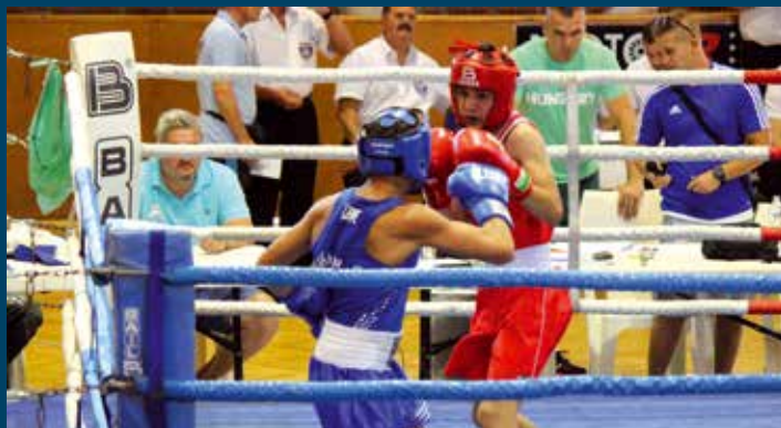
Küzdelemes mérkőzések a Matyó Kupán

A Matyó Kupát megtisztelte jelenlétével Erdei Zsolt, a Magyar Ökölvívó Szakszövetség elnöke és Szántó Imre, a magyar felnőtt válogatott korábbi szövetségi kapitánya is. bokri