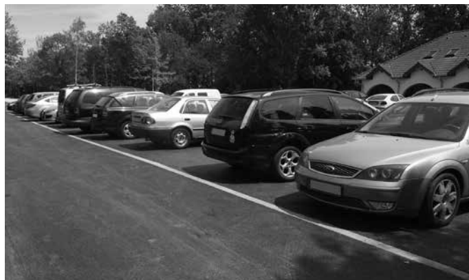
Már használhatók a fürdő előtti ingyenes parkolók – jó ütemben haladnak a Zsóry Liget projekt munkái

DÖNTÉSEK A testület idén is a települési önkormányzatok rendkívüli önkormányzati költségvetési támogatására igényt, továbbá az ez évre vonatkozóan lakossági víz- és csatornaszolgáltatás ráfordításainak csökkentésére irányuló támogatási kérelmet nyújt be. A Damjanich u. 1. sz. alatti Kollégium épületében az önkormányzat tulajdonában és használatában álló helyiségeket – az alagsorban 4 db raktárhelyiséget, illetve öltözőt, liftaknát, a földszinten található 4 db szobát, vizesblokkokat, folyosót, portahelyiséget és liftet – a testület a férőhelyek bővítése és a raktározási gondok megoldása érdekében a