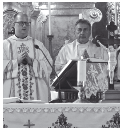
A Szent László Bűcsún a templom névadójára, az egyházközség védőszentjére emlékeznek a hívek