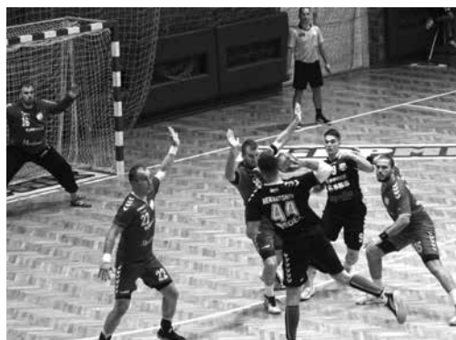
Izgalmas hajrá után pontosztokodással zárult az MKC – Eger mérkőzés