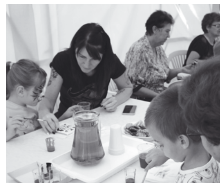
Rajzolásra, festésre is lehetőség nyílt a rendezvényen

A szervezet vezetője elmondta, a nap folyamán mintegy 70 gyermek vett részt a programokon, továbbá megköszönte a támogatók segítségét. A szünet-búcsúztató közös ebéddel zárult.