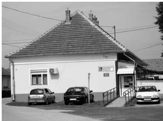
Az udvaron több mint 1 millió Ft értékben garázs fog épülni, melynek a munkálatai már elkezdődtek