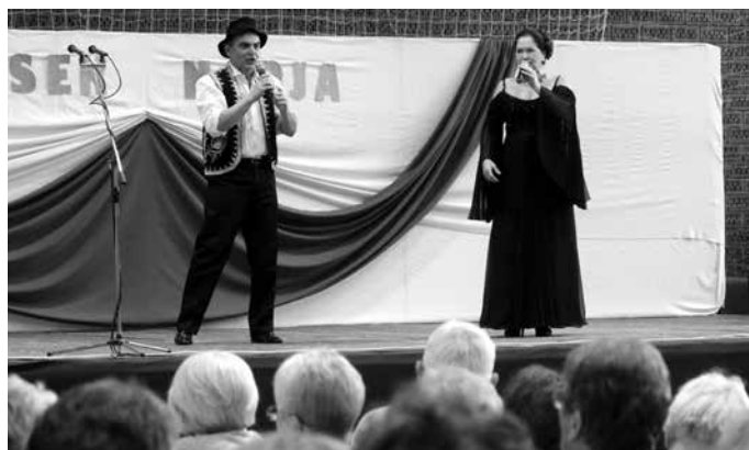
Sztárfellépők: Kállai Bori és Bozsó József

MŰSOR A program sztárvendégeként Kállai Bori érdemes művész és Bozsó József színművész lépett színpadra.