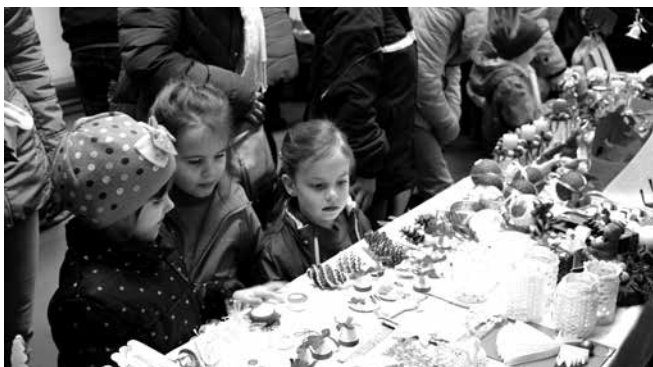
Ötletes ajándékok a Dohány úti Tagóvodában

Jótékonyági vásárokat szerveztek és ünnepségeket tartottak a Mezőkövesdi Óvoda és Bölcsőde négy tagóvodájában a karácsonyt megelőző várakozás időszakában.