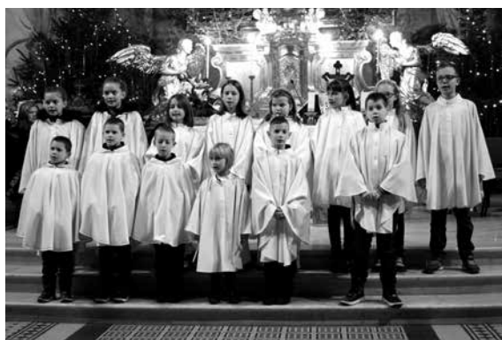
A gyermekek több karácsonyi dalt is énekeltek

A Szent László templomban rendezett eseményen 18 művet hallgathattak meg a résztvevők. Felcsendült többek között a Szép rózsabimbó nyílt ki, a Volnék csak kisharang, a Holy Night, valamint a Carol of the Bells című dal is, de Caccini, Wolf és Leonard Cohan egy-egy szerzeménye is elhangzott a színvonalas műsorban. A rendezvényen a Szent László Gyermekkórus is fellépett, előadásukban a Szeretet éj és az Ó gyönyörű szép című dalokat hallhatta a közönség. A nagyszerű, mintegy másfél órás produkció két közös műsorszámmal, a Soha nem volt még és a Csillagfényes éjszaka című dalokkal zárult.