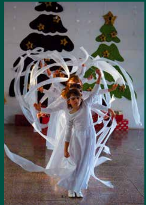
A mezősök műsorában több történetet és látványos koreográfiákat is láthattunk