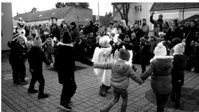
A László Károly úti Tagóvoda énekes, táncos műsora