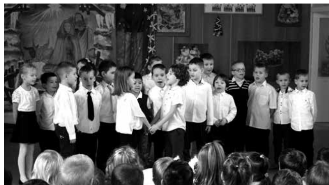
A Móra Ferenc úti Tagóvoda apróságai énekeltek és verset is mondtak