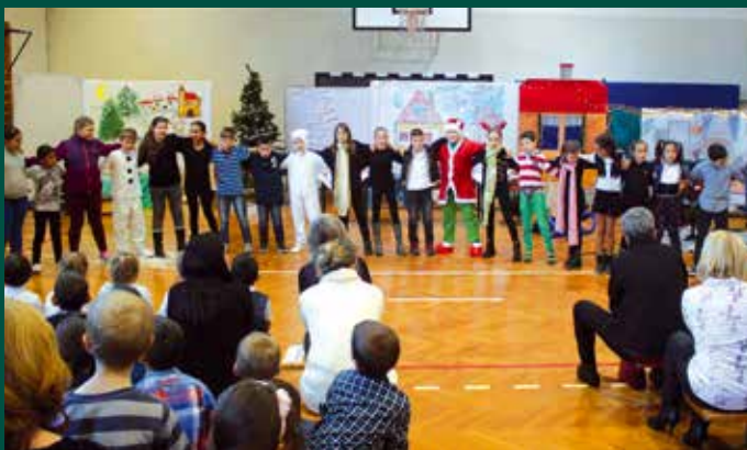
Karácsony a Szent Imrében: egy szórakoztató és egyben elgondolkodtató történet