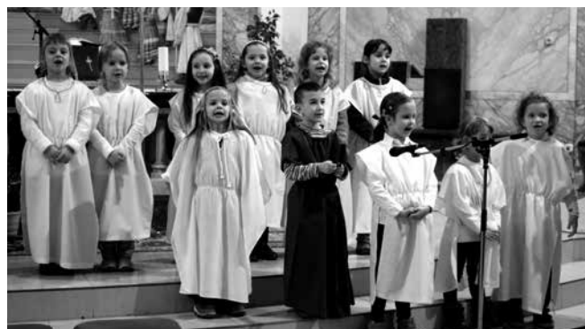
Az Egri úti Tagóvoda ovisainak betlehemes játéka