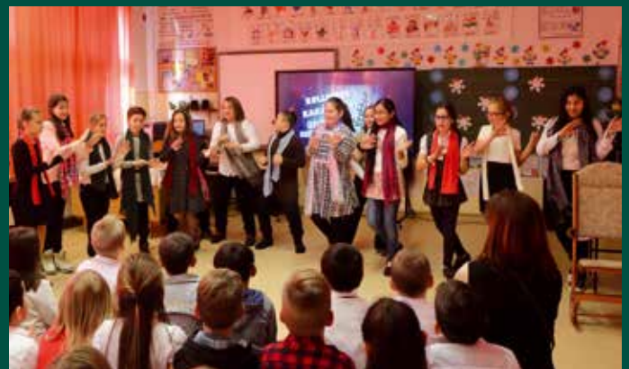
A Bárdos műsorában az ünnep valódi lényegét hangsúlyozták a tanulók