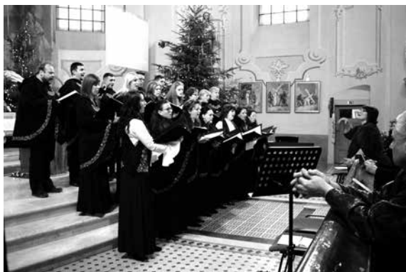
Színvonalas műsort hallhattunk a kórus előadásában

Huszonötödik alkalommal tartotta meg karácsonyi koncertjét a Szent László Kórus december 26-án.