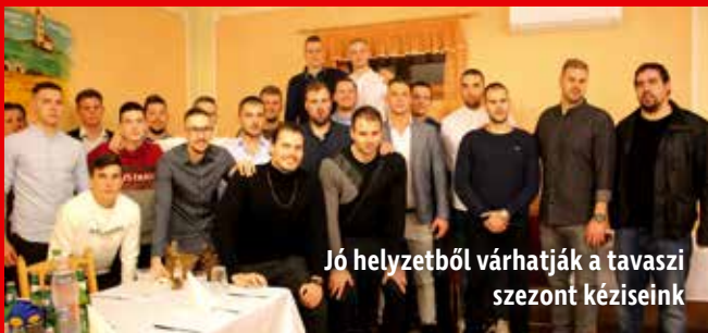
Jó helyzetből várhatják a tavaszi szezont kéziseink

Gőzerővel készül a tavaszi folytatásra a Mezőkövesdi KC felnőtt csapata.