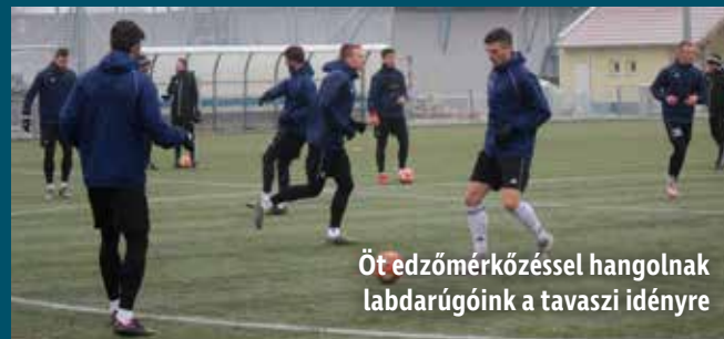
Öt edzőmérkőzéssel hangolnak labdarúgóink a tavaszi idényre

Háromhetes felkészülést követően január végén folytatja szereplését az OTP Bank Ligában a Mezőkövesd Zsóry FC.