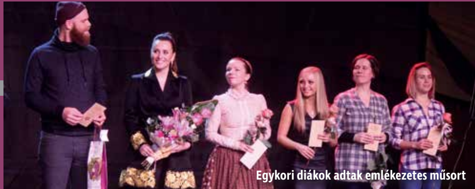
Egykori diákok adtak emlékezetes műsort