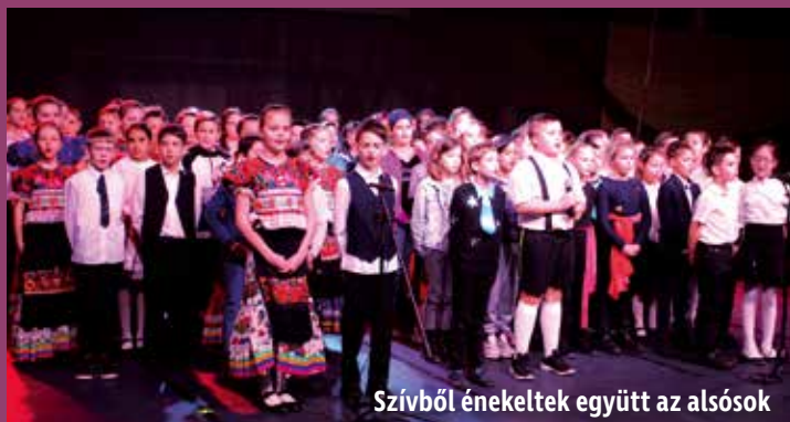
Szívből énekeltek együtt az alsók