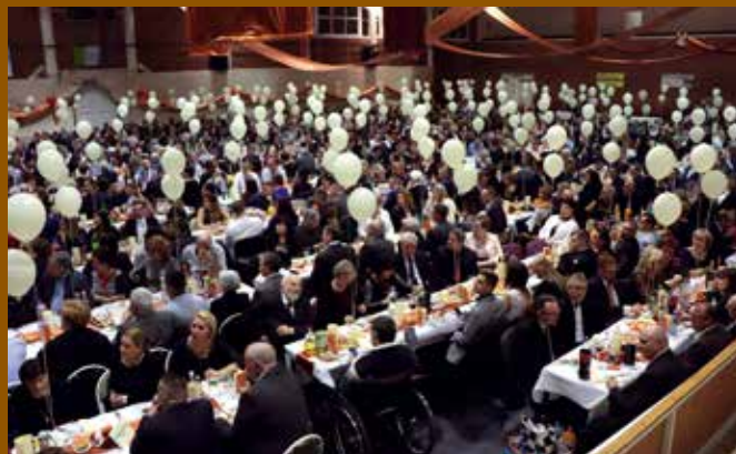
Idén is majdnem 900 ember bálozott együtt