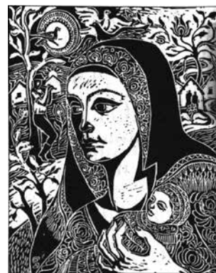
Matyó madonna Sorki Dala Andor alkotása

A könyvben kronológiai sorrendben szerepelnek a személyek, ezáltal könnyedén átlátható és megérthető, hogy az azonos korszakban városunkban tevékenykedők milyen