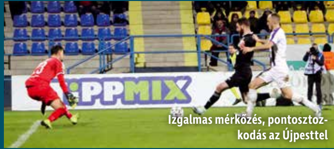
Izgalmas mérkőzés, pontosztokodás az Újpesttel

Hátrányból fordítva egygólos győzelmet aratott a Mezőkövesd Zsóry FC a Budapest Honvéd vendégeként az OTP Bank Ligában. Labdarúgóink az Újpest ellen döntetlent játszottak, míg a MOL Fehérvártól vereséget szenvedtek a bajnokságban.