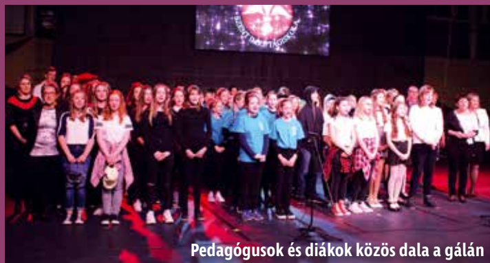
Pedagógusok és diákok közös dala a gálán