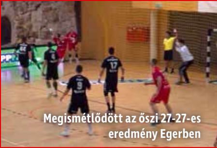
Megismétlődött az őszi 27-27-es eredmény Egerben

Izgalmas hajrá után döntetlent játszott Egerben a Mezőkövesdi KC felnőtt csapata, míg a Dabas ellen szoros mérkőzésen kikapott a K&H Férfi Kézilabda Ligában.