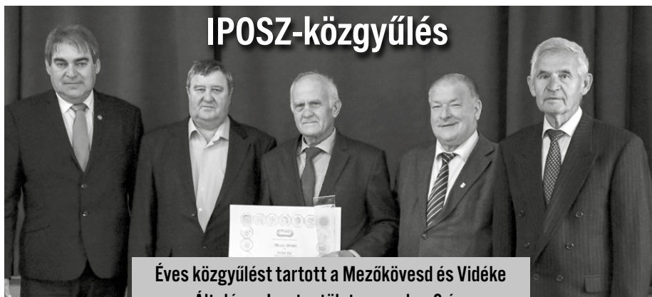
Éves közgyűlést tartott a Mezőkövesd és Vidéke Általános Ipartestület november 8-án.

A konferencián résztvevő, a régióból érkező orvosok és szakdolgozók mintegy száz, a belgyógyászat számos területével foglalkozó előadást hallgathattak meg. hmzs