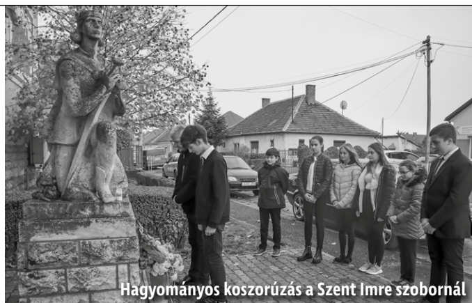
Hagyományos koszorúzás a Szent Imre szobornál

– Az elmúlt két hétben 20 verseny, vetélkedő zajlott le iskolánkban, amelyen mintegy 150 diákunk vett részt. Hagyományosan volt rajzverseny, olvasási, szépíró-, helyesírási, illetve matematikaverseny. De most már van biológia verseny, illetve újtás volt a Vízre fel! című vetélkedőnk, ahol a környezettudatosságra, a víz fontosságára igyekeztünk felhívni a figyelmet. Emellett a logimatekot és a Rubik-kocka versenyt is szerveztünk a két hét