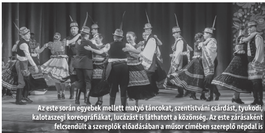
Az este során egybekeltek mellett matyó táncokat, szentistváni csárdást, tyukodi, kalotaszegi koreográfiákat, lucázást is láthatott a közönség. Az este zárásaként felcsendült a szereplők előadásában a műsor címében szereplő népdal is

– A háromnapos rendezvényünk egy ünnep. A matyó népművészet hungarikummá nyilvánításá-