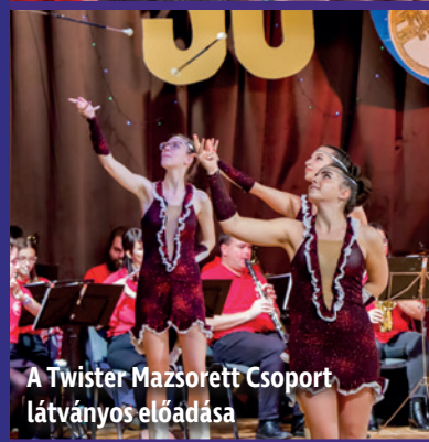
A Twister Mazsorett Csoport látványos előadása