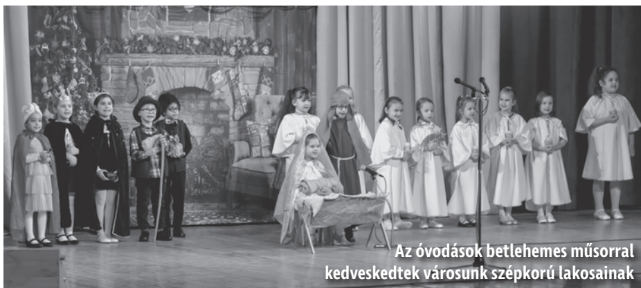
Az óvodások betlehemes műsorral kedveskedtek városunk szépkorú lakosainak