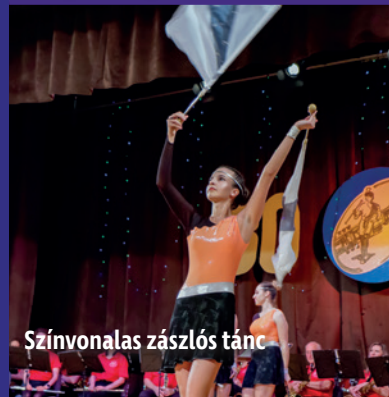
Színvonalas zászlós tánc