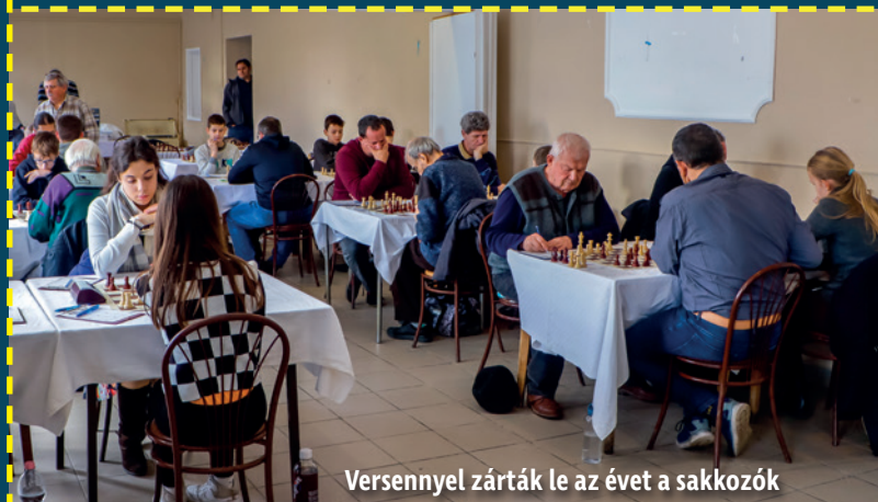
Versennyel zárták le az évet a sakkosok