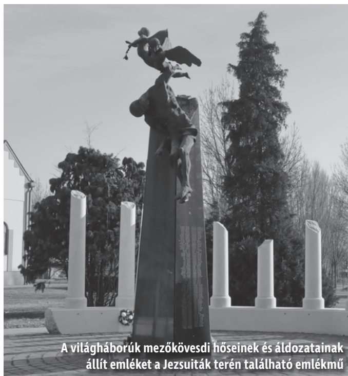
A világháborúk mezőkövesdi hőseinek és áldozatainak állít emléket a Jezsuiták terén található emlékmű

Hlavács arca kipirult és szeme szinte indulatosan villant fel.