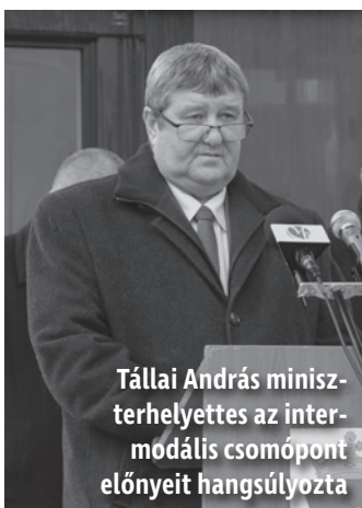
Tállai András miniszterhelyettes az intermodális csomópont előnyeit hangsúlyozta

December 15-én tartották meg az új autóbusz-állomás átadó ünnepségét.