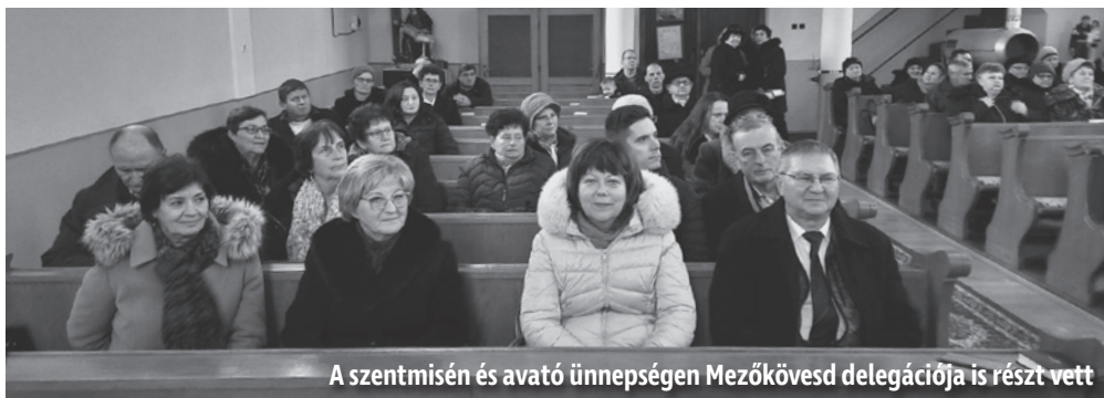
A szentmisén és avató ünnepségen Mezőkövesd delegációja is részt vett