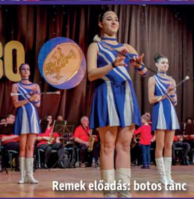
Remek előadás: botos tánc