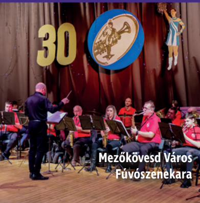
Mezőkövesd Város Fúvószenekara