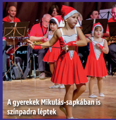
A gyerekek Mikulás-sapkában is színpadra léptek