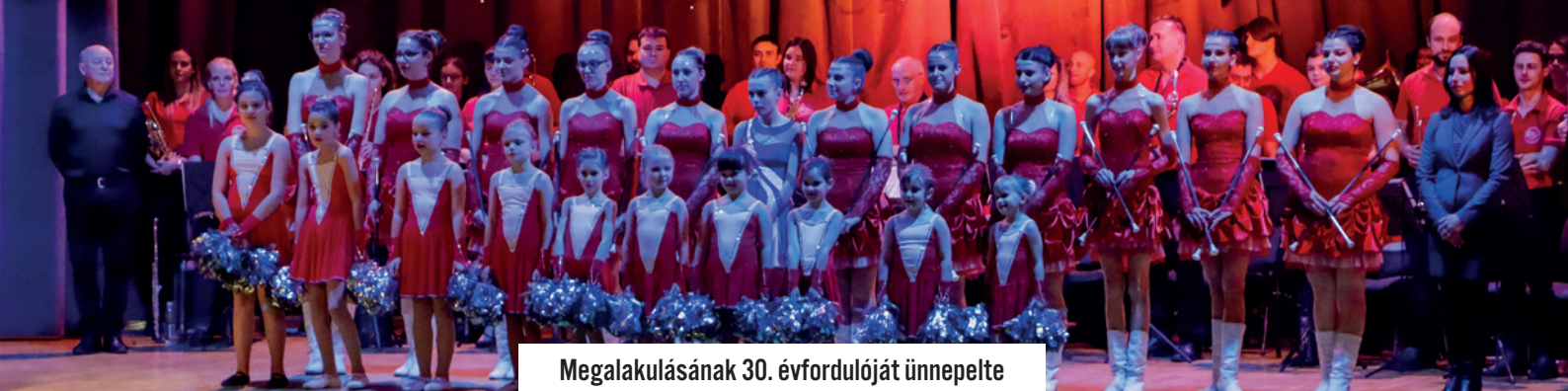
Megalakulásának 30. évfordulóját ünnepelte a mezőkövesdi Mazsorett Csoport.