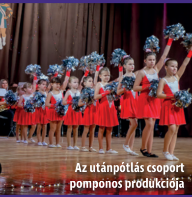
Az utánpótlás csoport pomponos produkciója