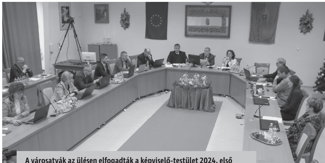
A városatyák az ülésen elfogadták a képviselő-testület 2024. első félévére vonatkozó munkatervét, valamint az önkormányzat 2024. évi belső ellenőrzési tervét is, továbbá önkormányzati ingatlanok hasznosításáról is szavaztak a képviselők.

A Nemzeti Biodiverzitás és Génmegőrző Központ által biztosított 110 alma,