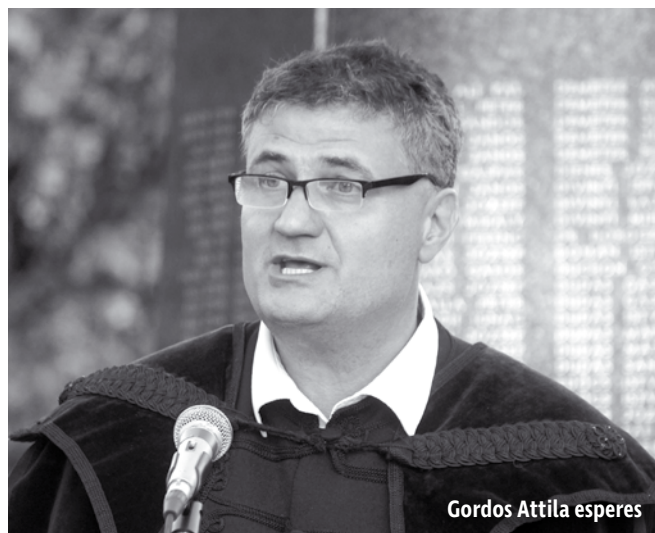
Gordos Attila esperes

Jézus mondja: Én vagyok a feltámadás és az élet. Ez így volt