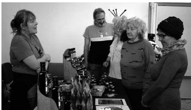
A kertbarátok az előadás keretében a Detki Kenderanya termékeivel is megismerkedhettek

A jövőben ehhez az üzletághoz kapcsolódóan több terméktranszfer is érkezik, így a Modine mezőkövesdi gyára válik a cégcsoport alumínium haszongépjármű-hűtő gyártásának európai központjává. M. H.