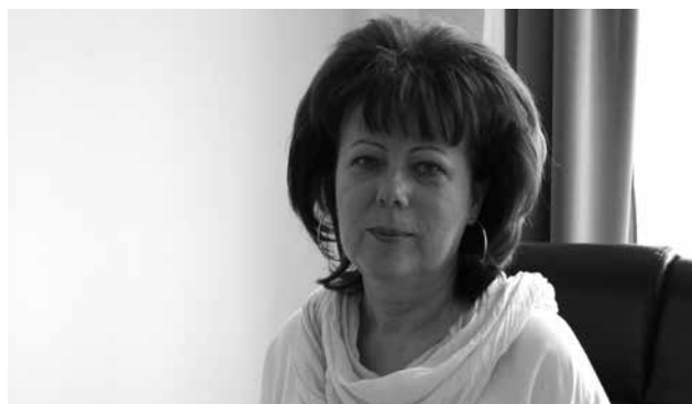
Az előző évekhez hasonlóan alakul a diákok létszáma az új tanévben is a mezőkövesdi tagiskolákban

Öt osztályban 104 elsősrel, így összesen 771 diákkal és 39 osztállyal indul a 2020/2021-es tanév a Mezőkövesdi Általános Iskola helyi tagiskoláiban.