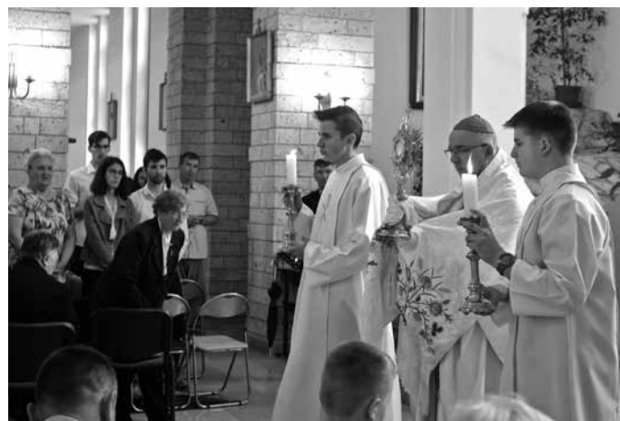
Jelképes, rövid körmenetet tartottak a templom falai között