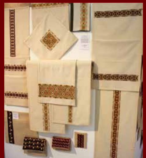
Subrika motívumok a Kétsopronyi Hímző Szakkör alkotásain