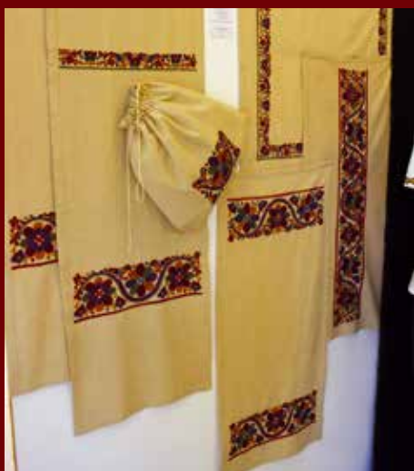
Mezőberényi Díszítőművészeti Szakkör: Szentistváni hagyományos lepedővégek

A pályázat anyagából összeállított tárlatot szeptember 27-éig lehet megtekinteni a Matyó Múzeumban. B. K.