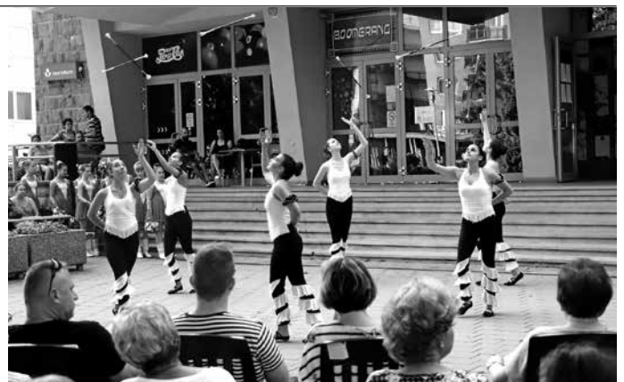
A twisteres lányok ezúttal is kitétek magukért

Mezőkövesd Város Fúvószenekara, a Twister és a Gyémánt mazzorett csoportok adtak műsort július 5-én.