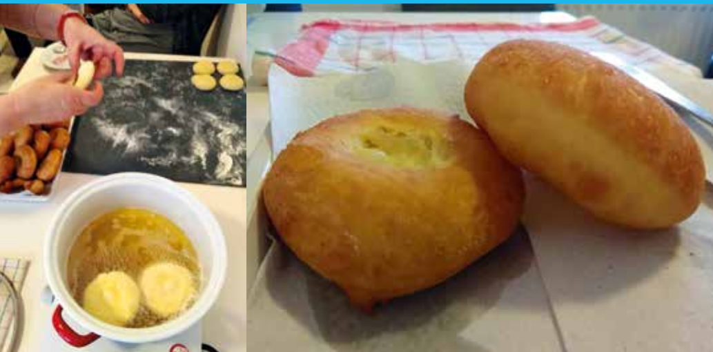
Farsangi fánkot sütöttek a Matyó Múzeum dolgozói felidézve a régi matyó szokásokat

A Matyó Múzeum bár zárva tart a járványhelyzet miatt – mégis arra törekszik, hogy ugyan online térben, de tovább éltesse – átadja az utókornak a gazdag és értékes matyó kultúrát. Az intézmény közösségi oldalán folyamatosan olyan tartalmakat tesznek közzé, amelyek az adott időszakhoz, ünnepkörhöz kötődő matyó hagyományokat mutatnak be.