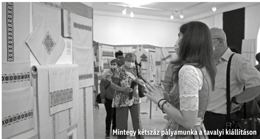
Mintegy kétszáz pályamunka a tavalyi kiállításon

A Matyó Népművészeti Egyesület 2002-ben rendezte meg első alkalommal a Százrózsás Országos Hírművészeti Pályázatot és Kiállítást. A szervezők célja az, hogy minél több alkotó figyelmét irányítsák a matyó hírművészet felé, teremtse meg a megismerés és bemutatás lehetőségét mindazok számára, akik Mezőkövesd és környékének textilkultúráját feldolgozzák. A háromévente megrendezésre kerülő országos verseny alkalmával közel 100 egyéni és csoportos pályázó küld be mintegy 300 pályamunkát. A pályázati darabok bírálatát minden alkalommal kiváló szakemberek végzik, javaslatok alapján kerülnek a tárgyak bemutatásra, illetve díjazásra. A kiállítás mindig nagy sikert arat a látogatók körében, melynek helyszínül a Matyó Múzeum szolgál.