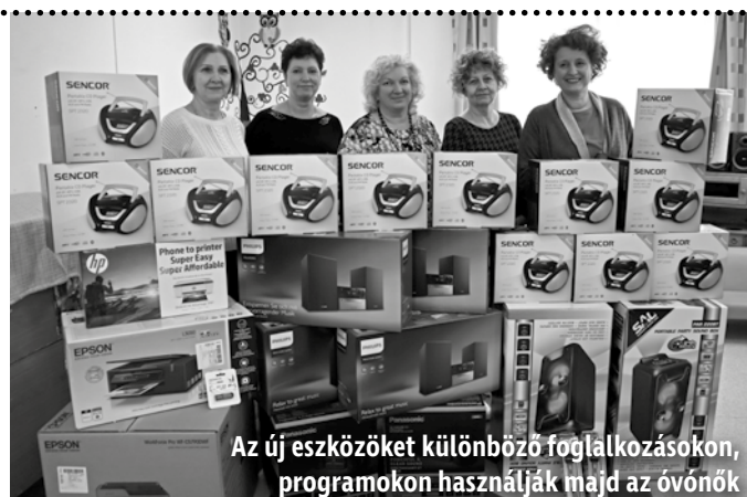
Az új eszközöket különböző foglalkozásokon, programokon használják majd az óvónők

Mintegy hétszázezer forint értékben vásárolt infokommunikációs eszközöket a Mezőkövesdi Óvoda és Bölcsőde.