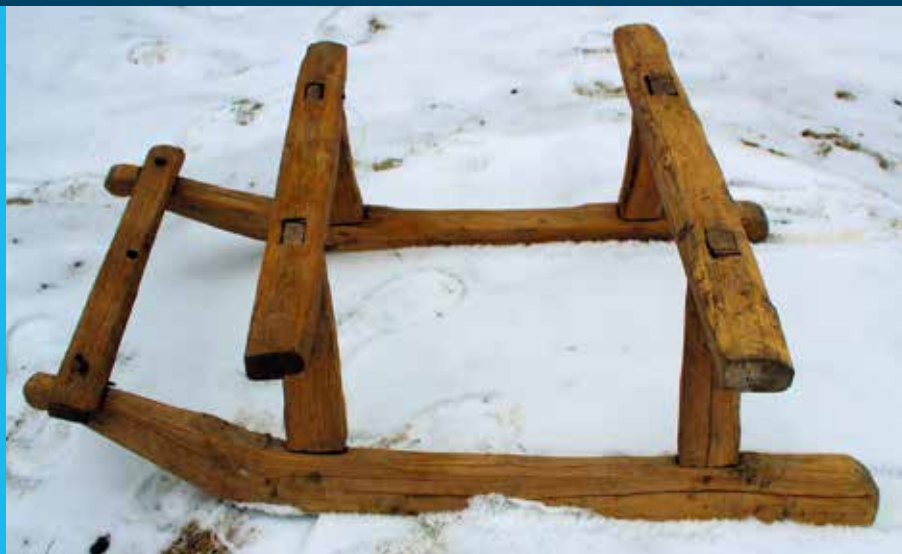
SZÁNKÓ – a hónap tárgya a Matyó Múzeumban

A HÓNAP TÁRGYA | A havazás, a hófedte dombok nemcsak a mai kor gyermekét vonzzák a játékra, hanem őseink fiataljai is éltek a tél nyújtotta szórakozási lehetőségekkel – csak egy kicsit másként. Míg ma készen megvásároljuk a korcsolyát, a szánkót, addig az 1800-as, 1900-as évek gyermekei sokszor maguk készítették el téli játékszereiket, amelyek jóval egyszerűbbek voltak a mostaniaknál. Ilyen például a Matyó Múzeumban hónap tárgyának megválasztott szánkó, amelyet 1933-ban készített egy szentistváni ember kislánya számára fából, úgy, hogy az enyhén hajlított szántalpakhoz a keresztfák csapolással illeszkednek.