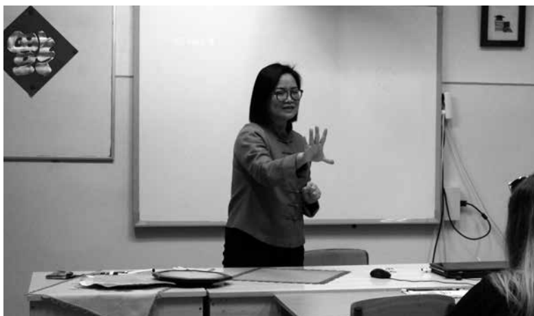
A képzésre 9., 10. és 12. évfolyamos mezőkövesdi diákok is jelentkeztek

A gimnázium diákjai mellett további öt tanuló kapcsolódott be a képzésbe olyan középiskolákból, amelyek a szervező, a Miskolci Egyetem Konfuciusz Intézetével kapcsolatban állnak. A képzést Zoom-on keresztül egy magyar oktató vezeti, és június 15-én egy ismétlő-értékelő órával zárul. A tanfolyam már nem az első olyan képzés az iskolában, amely lehetőséget biztosít a kínai nyelv alapjainak elsajátítására, de a korábbiaktól eltérően ezúttal csak diákok számára hirdették meg a kurzust.