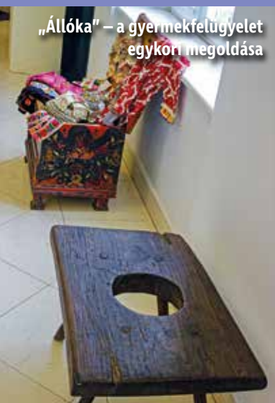
„Állóka” – a gyermekfelügyelet egykori megoldása