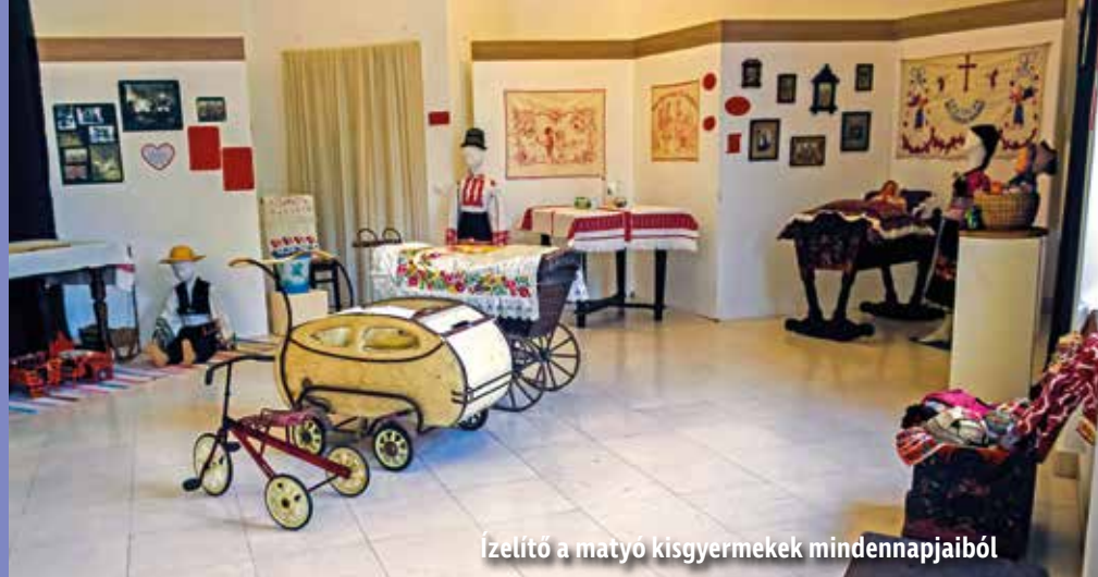
Élvező a matyó kisgyermekek mindennapjaiból