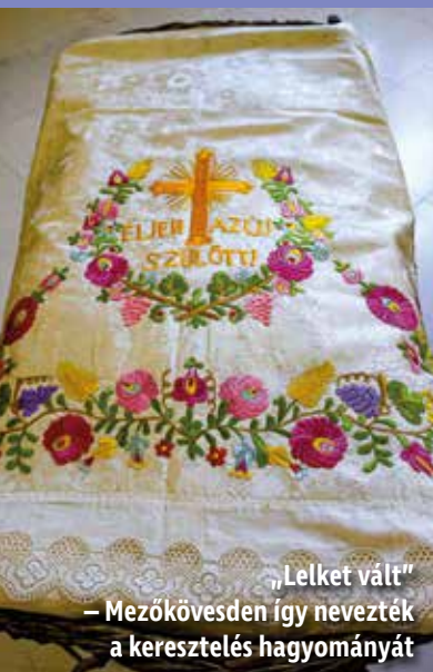
„Lelket vált” – Mezőkövesden így nevezték a kereszteleő hagyományát

A múzeumi világnap alkalmából megnyílt Varázslatos gyermekvilág című időszaki kiállítás augusztus 31-ig látható. D. A.