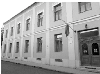
Mezőkövesd, Morvay János u. 1. szám alatti irodahelyiségek (emelet 4 irodahelyiség és egyéb helyiségek összesen: 101 m 2 ) Az udvaron parkolók bérelhetők.