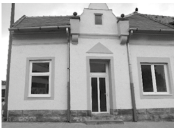
Mezőkövesd, Eötvös u. 1. szám alatti üzlethelyiség: (2 helyiség és mosdó, WC, raktár összesen 50 m 2 , teljesen felújított állapotban)

Az ingatlanok megvásárlására vonatkozó ajánlatokat Mezőkövesd Város Polgármestere részére levélben lehet benyújtani az alábbi címre: 3400 Mezőkövesd, Mátyás király út 112. számon vagy emailben a polgarmester@mezokovesd.hu címre.