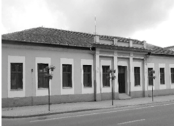
Mezőkövesd, Alkotmány u. 2. (3 főhelyiség, konyha, raktárak, mosdóhelyiségek összesen 530 m 2 )

Mezőkövesd Város Önkormányzata értékesítésre meghirdeti az alábbi, a város központjában elhelyezkedő ingatlanokat: