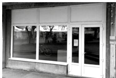
a Mezőkövesd, Szent László tér 11. szám alatti 78 m 2 alapterületű üzlethelyiséget,

Mezőkövesd Város Önkormányzata értékesítésre hirdeti meg