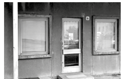
valamint a Mezőkövesd, Szent László tér 11. szám alatti 17 m 2 alapterületű üzlethelyiséget.

Az ingatlanok megvásárlására vonatkozó ajánlatokat Mezőkövesd Város Polgármestere részére levélben lehet benyújtani az alábbi címre: 3400 Mezőkövesd, Mátyás király út 112., vagy emailben a polgarmester@mezokovesd.hu címre.