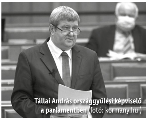
Tállai András országgyűlési képviselő a parlamentben