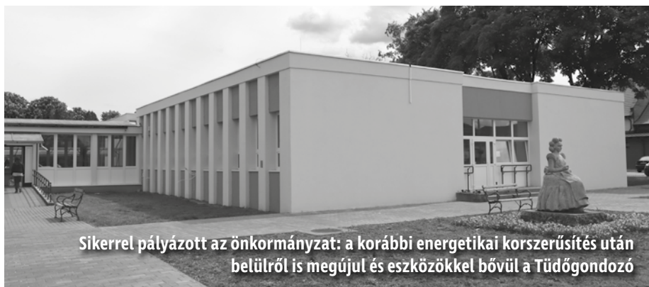
Sikerrel pályázott az önkormányzat: a korábbi energetikai korszerűsítés után belülről is megújul és eszközökkel bővül a Tüdőgondozó