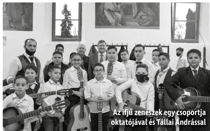
Az ifjú zenészek egy csoportja oktatójával és Tállai Andrással