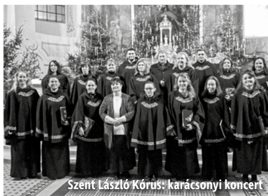
Szent László Kórus: karácsonyi koncert

KARÁCSONY | Pásztorjátékot mutattak be a hittanos gyerekek december 25-én a Szent László templomban. Jézus születésének történetét a 9 órai szentmise előtt lehetett megtekinteni.