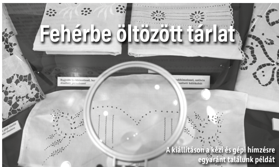
A kiállításon a kézi és gépi hímzésre egyaránt találunk példát

A magyarországi fehérhímzések típusait bemutató időszaki kiállítás látogatható a Matyó Múzeumban. A mintegy 200 tárgyat felvonultató tárlat a szolnoki Damjanich János Múzeum anyagából állt össze.