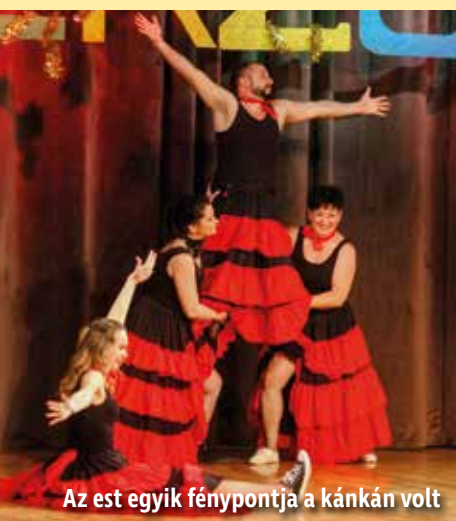
Az est egyik fénypontja a kánkán volt