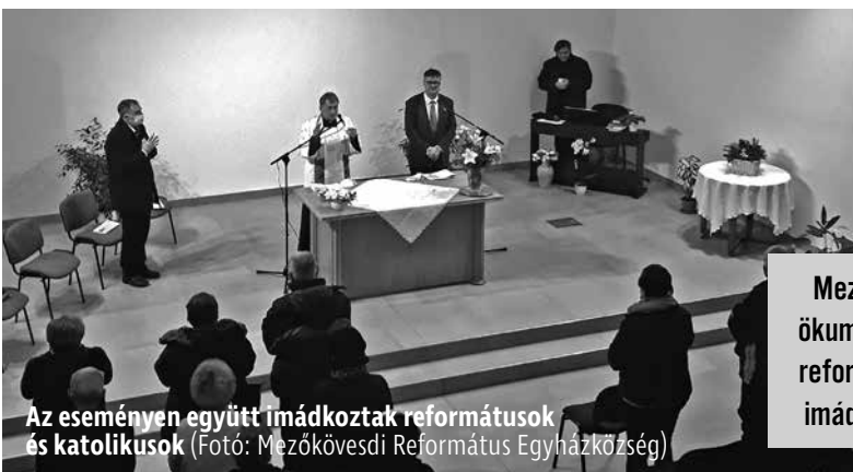
Az eseményen együtt imádkoztak reformátusok és katolikusok