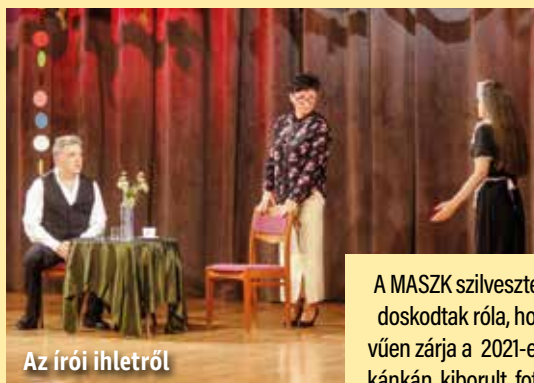
Az írói ihletről