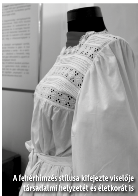
A fehérhímzés stílusa kifejezte viselője társadalmi helyzetét és életkorát is

– Egyrészt az azonos alapszín és díszítmény különös hatása miatt kedves számomra a téma, valamint az is érdekes, hogy 40-50 évvel ezelőtt a fehérhímzés általánosan elterjedt volt, mindenki szerette és ragaszkodott hozzá. Népszerűsége mögött felfedezhető az oktatás hatása, a helyi hagyományok is be tudták illeszteni az iskolából jövő ismereteket, mint például Mezőkövesden is – mondta el a kiállítás kurátora.