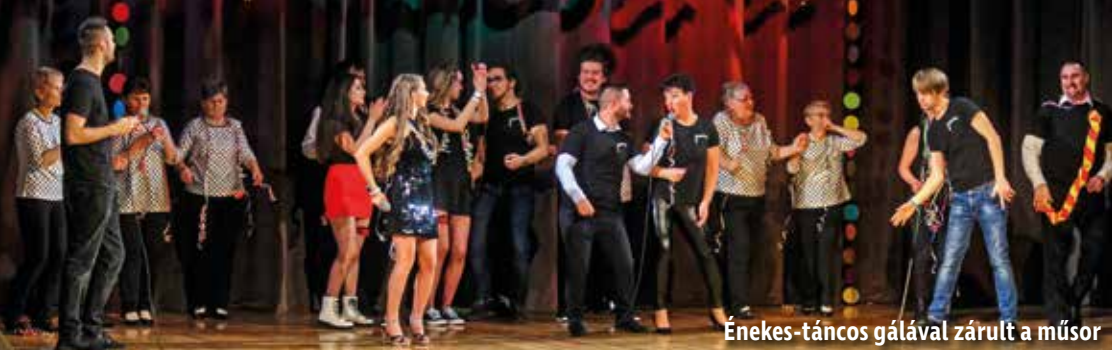
Énekes-táncos gálával zárult a műsor