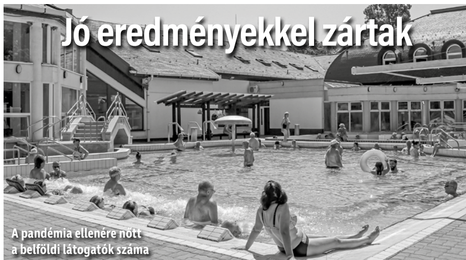
A pandémia ellenére nőtt a belföldi látogatók száma