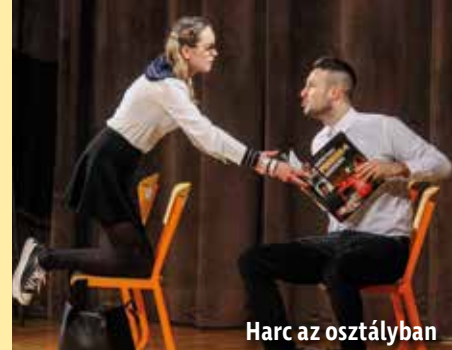
Harc az osztályban