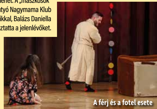
A férj és a fotel esete

„...Ígézve álltam, soká, csöndesen, És percek mentek, ezredévek jöttek - Egyszerre csak megfogtad a kezem, S alélt pilláim lassan felvetődtek, És éreztem: szívembe visszatér És zuhogó, mély zenével ered meg, Mint zsibbadt erek útjain a vér, A földi érzés: mennyire szeretlek!”