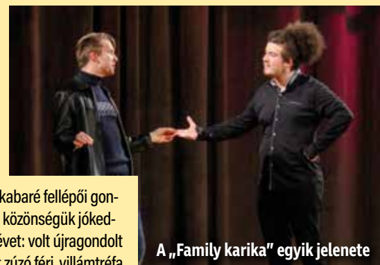
A „Family karika” egyik jelenete