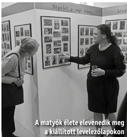
A matyók élete elevenedik meg a kiállított levelezőlapokon

Kiállítások, előadások, könyvbemutató és koncertek jellemezték Mezőkövesd kulturális életét az elmúlt időszakban.