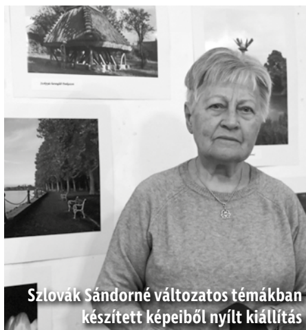
Szlovák Sándorné változatos témákban készített képeiből nyílt kiállítás