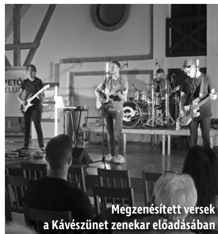
Megzenésített versek a Kávészünet zenekar előadásában