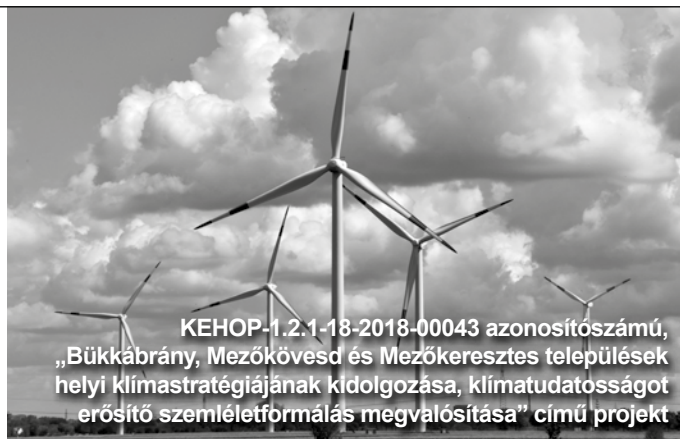
KEHOP-1.2.1-18-2018-00043 azonosítószámú, „Bükkábrány, Mezőkövesd és Mezőkeresztes települések helyi klímastratégiájának kidolgozása, klímatudatosságot erősítő szemléletformálás megvalósítása” című projekt

Mindennapi tevékenységeink mind-mind visszavezethetők valamilyen ipari ténykedésre, amely hozzájárul környezetünk