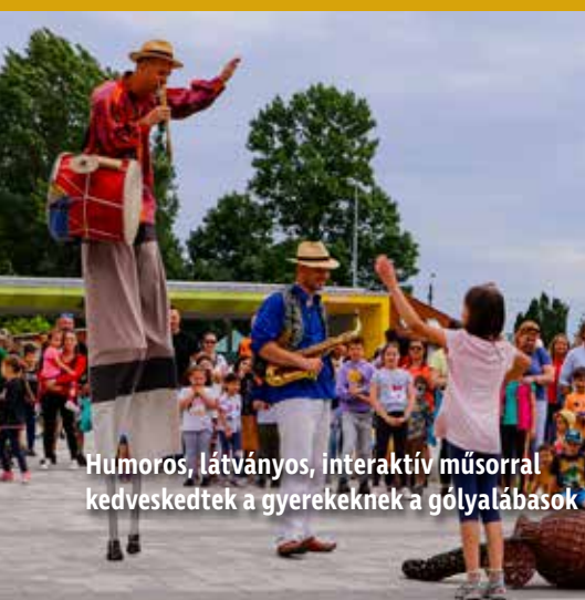
Humoros, látványos, interaktív műsorral kedveskedtek a gyerekeknek a gólyalábasok