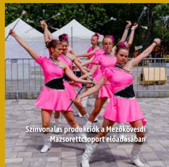
Színvonalas produkciók a Mezőkövesdi Mazsorettcsoport előadásában