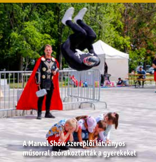
A Marvel Show szereplői látványos műsorral szórakoztatták a gyereket

Az átadón felléptek az új matyó ruhába öltözött óvodások, a Matyó Népi Együttes tagjai, a Matyó Népművészeti Egyesület Pöttöm és Ragyogó néptáncsoportjai, valamint Mozer Attila vezetésével a Mezőkövesdi Alapfokú Művészeti Iskola fúvós kamaragyüttesének műsorát is meghallgathatták a jelenlévők. A műsort táncház után közös karulás zárta a Jézus Szíve templomnál. B. Krisztián