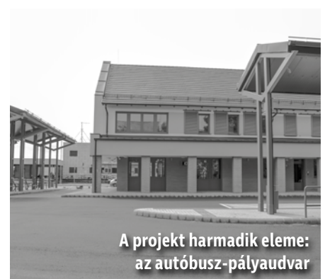
A projekt harmadik eleme: az autóbusz-pályaudvar