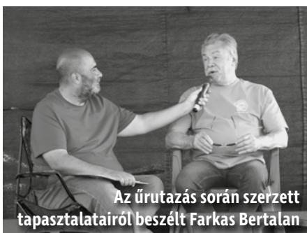
Az űrutazás során szerzett tapasztalatairól beszélt Farkas Bertalan