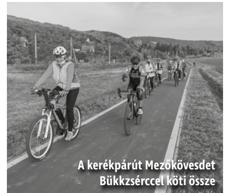
A kerékpárút Mezőkövesdet Bükkzsérccel köti össze