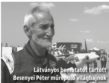
Látványos bemutatót tartott Besenyei Péter műrepülő világbajnok