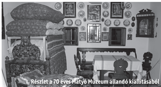
Részlet a 70 éves Matyó Múzeum állandó kiállításából

IMPRESSZUM | Kiadó: Mezőkövesdi Média Nonprofit Kft. | Felelős kiadó: Mezőkövesdi Média Nonprofit Kft. mindenkor vezetője | Felelős szerkesztő: Bodnár Ágota | Nyomdai előkészítés: Barczy Gábor | Újságírók: Hócza-Molnár Zsannett, Bódi Krisztián | Szerkesztőségi titkár: Bíró Gáborné | A szerkesztőség címe: 3400 Mezőkövesd, Szent László tér 11. | Telefon: 49/500-177 | Ímél: info@kovesdimedia.com | ISSN 0239-0264 | Olvasói leveleket a lap lehetőségéhez igazítva, szerkesztve, rövidítve közlünk. Kéziratokat, fotókat nem áll módunkban megőrizni, visszaküldeni. | Lapzárta: 2023. augusztus 4.