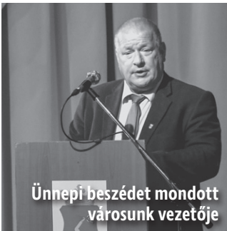
Ünnepi beszédet mondott városunk vezetője