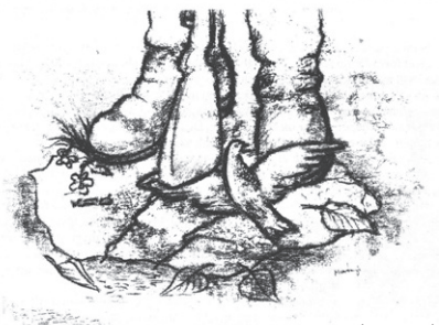
Murányi József: Magyar sors (szénrajz)