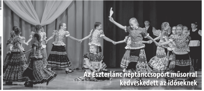
Az Eszterlanc néptáncsoport műsorral kedveskedett az időseknek